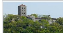
The Met Cloisters

The Wikimedian-in-Residence Pharos aims to "Wiki-fy the Met, and Met-ify the Wiki", bringing together the complementary strengths of global volunteerism and institutional knowledge.