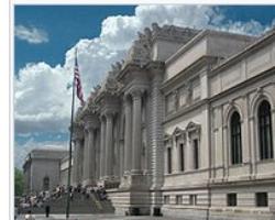
The Met Fifth Avenue