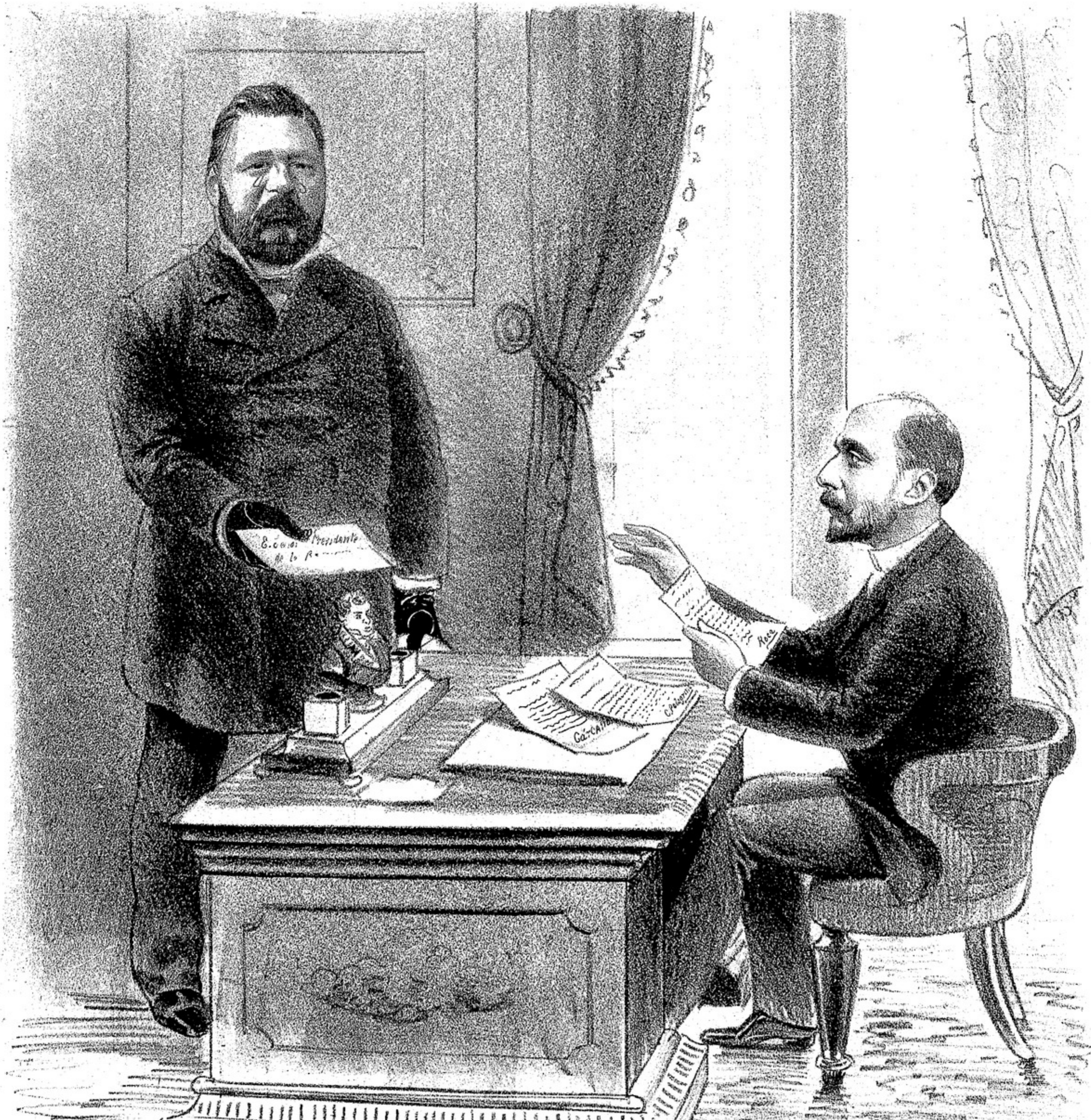
G.S.— Señor Presidente, aunque Y. E. se olvido pedírmela, aqui le traigo mi solemne declaracion de que no he de permitir, aunque revientan misfeles partidarios Doyo y Alaliva, que mi nombre sirva de bandera en la próxima contienda electoral presidencial.

Año XXVII núm. 1423 SUSCRICION MENSUAL: En la Capital..... $ 100 / 100 0.60 » las Provincias..... » 0.75 SUSCRICION ANUAL: Con la prima En la Capital..... $ 100 / 100 7.00 » las Provincias..... » 8.00 PAGADO ADELANTADO Para 1890 la prima consiste en cuatro retratos en cartulina de ilustres argentinos.