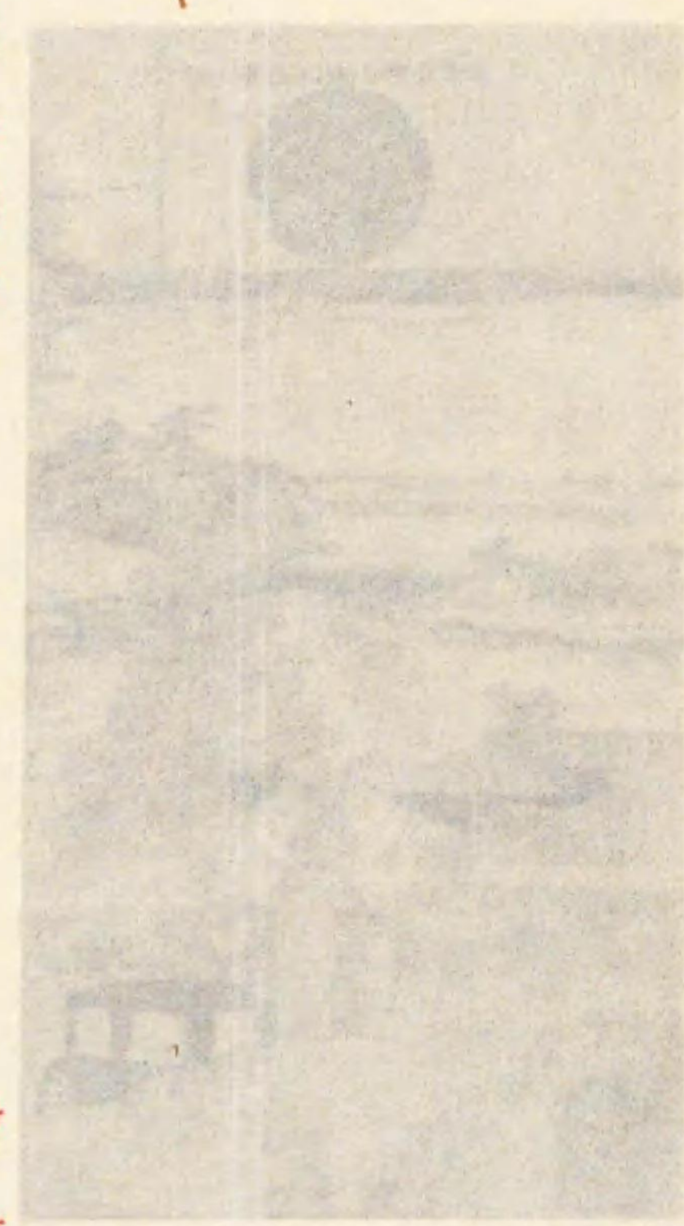
明治天皇上野公園行幸錦繪