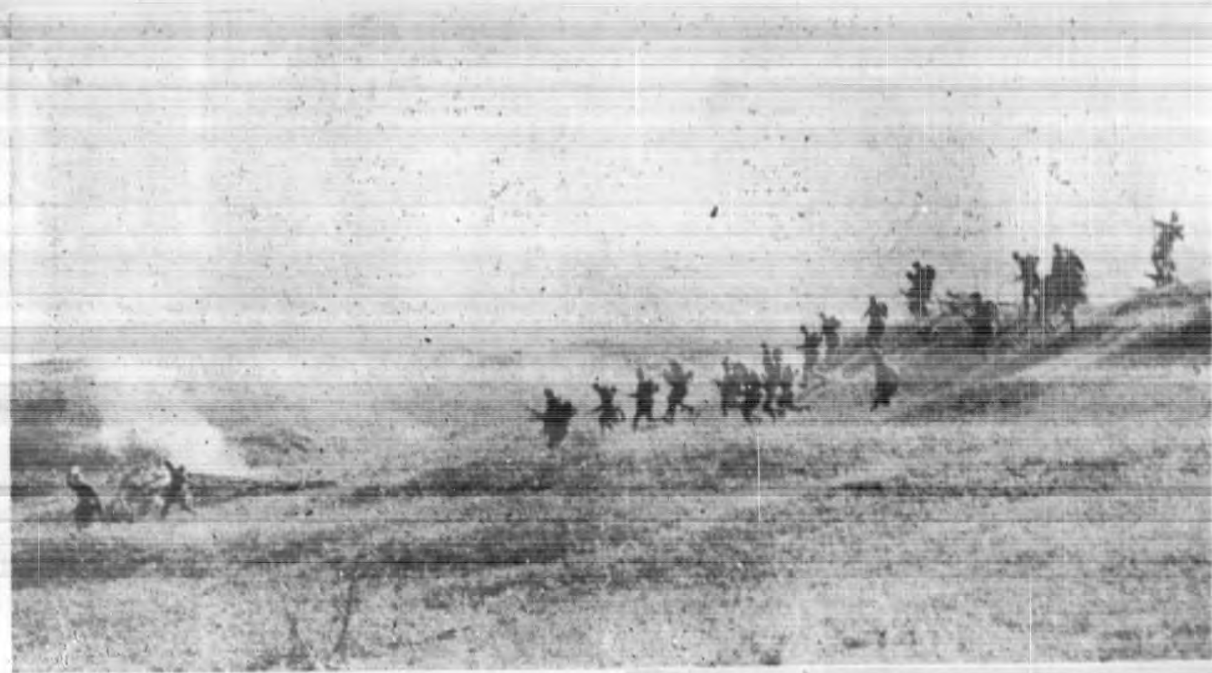
新鄉東郊我步兵射敵之雄姿 →