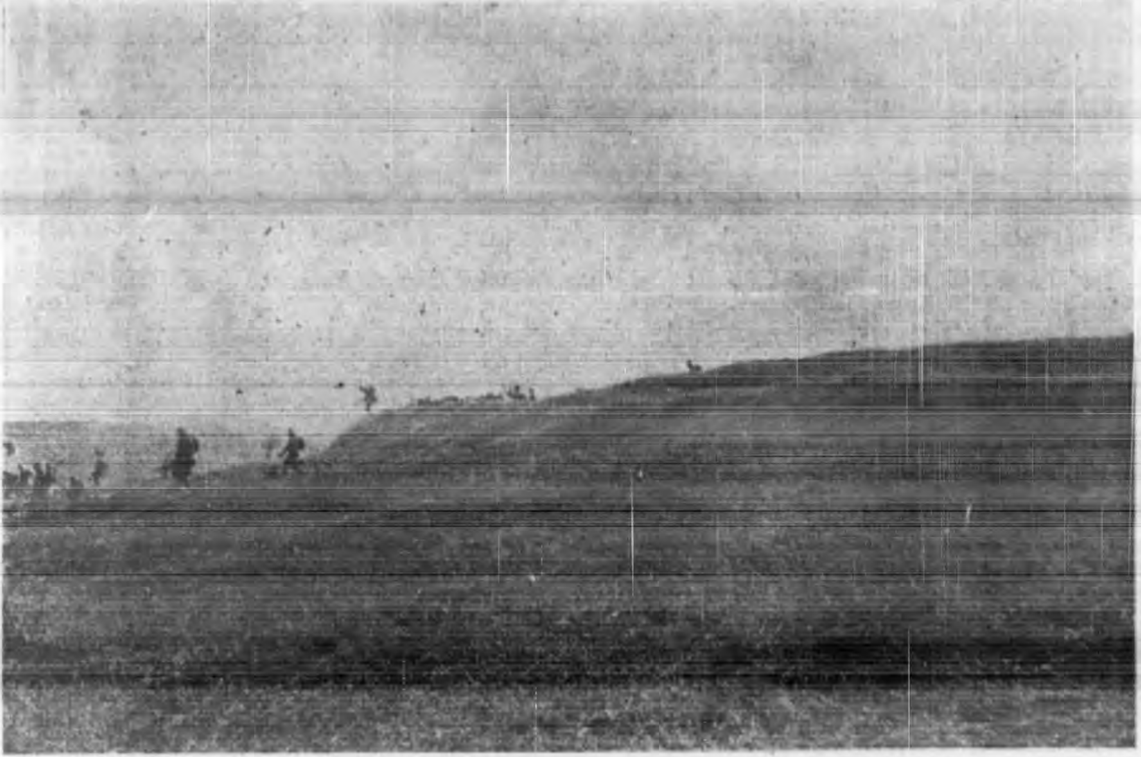
鳳陽附近我機槍之射敵