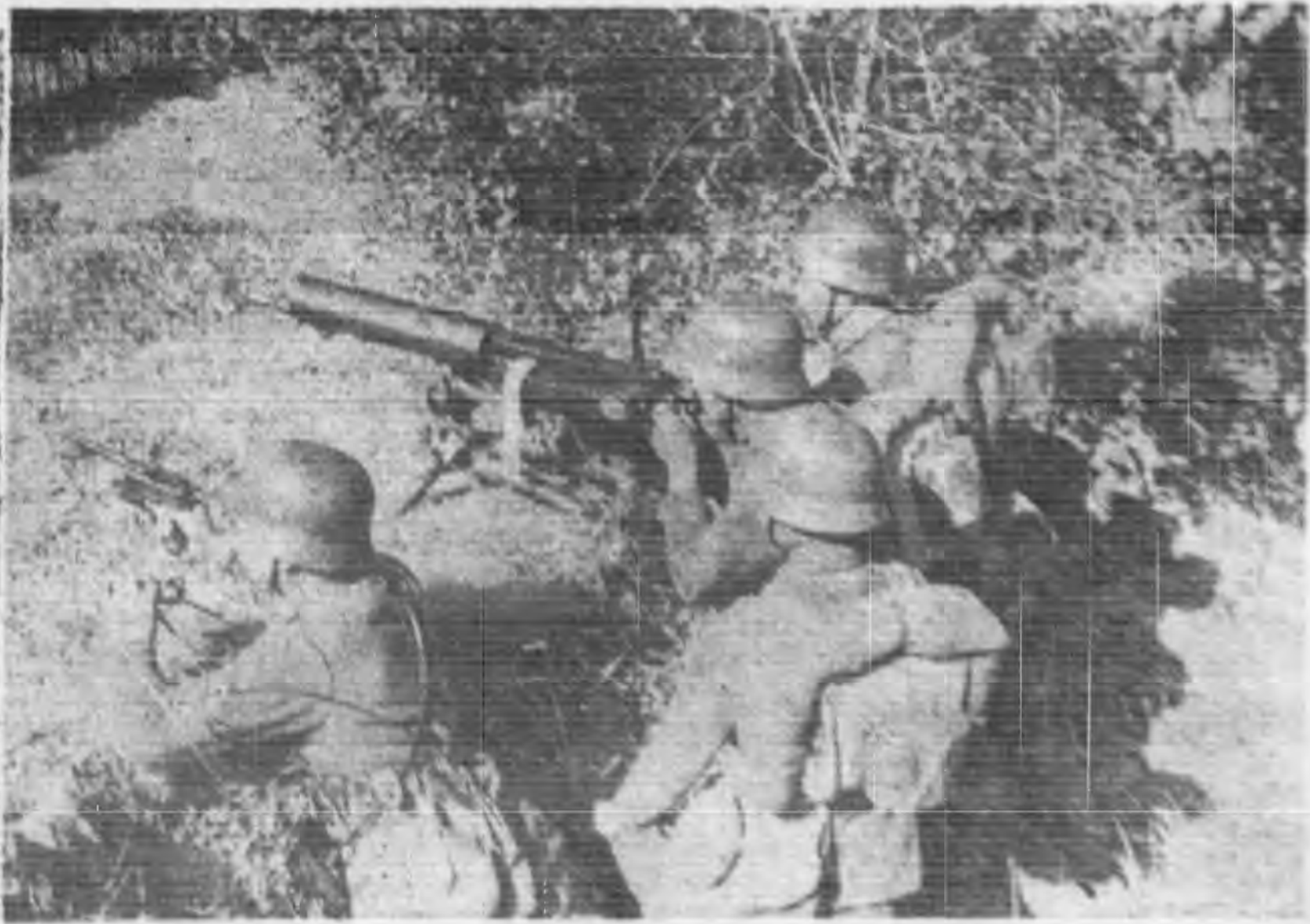
↑ 臨汾附近我生力軍之射敵