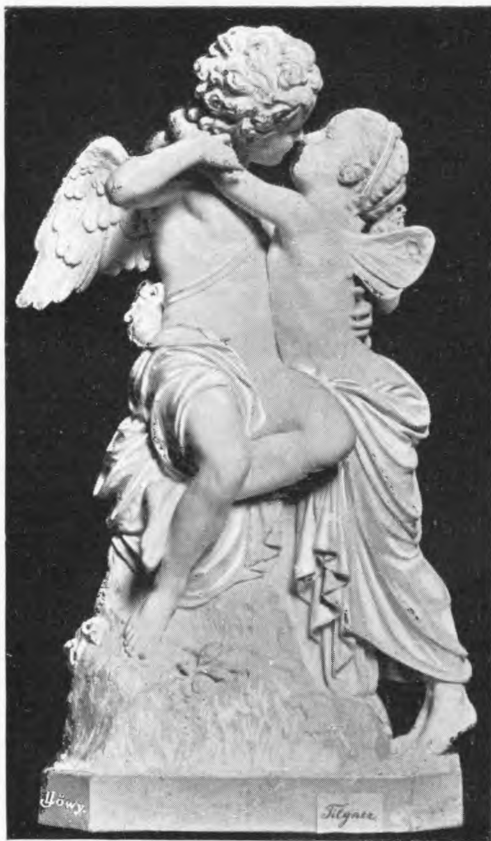
Amor und Psyche, Jugendwerk.