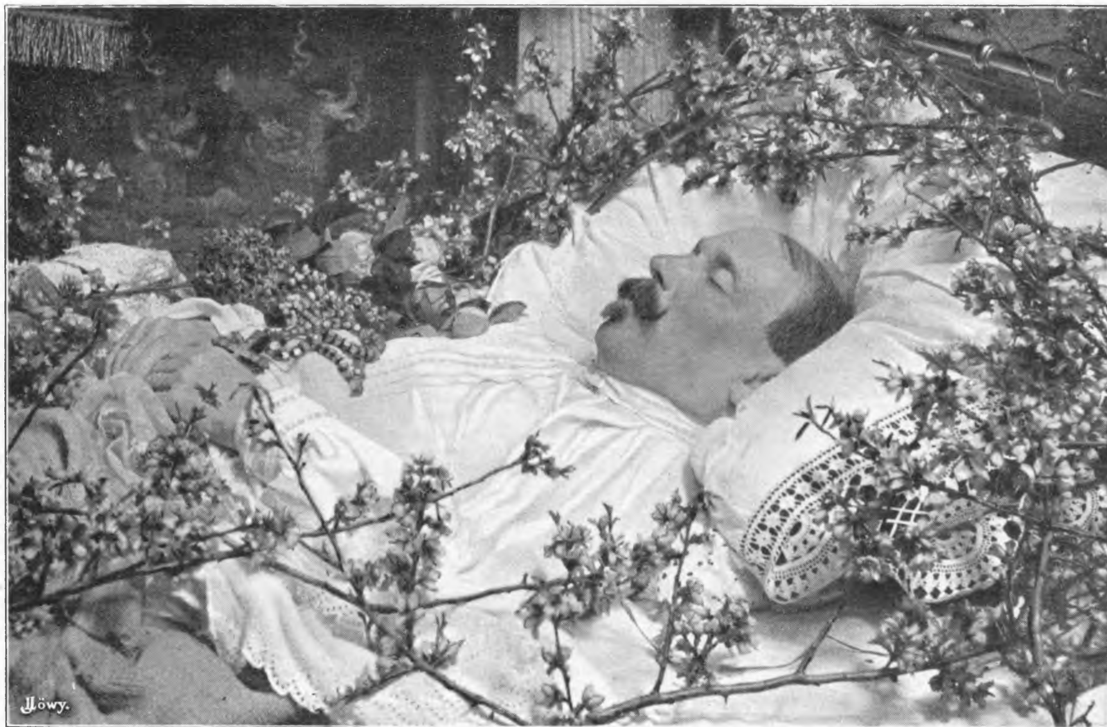
Tilgner auf dem Todtenbette.

das Historische seines Faches studirte und zugleich die neuesten Leistungen im Auge behielt. Als der Katalog seines Nachlasses erschien, staunte man über die Reichhaltigkeit dieses Hausmuseums. Unzählige Berühmtheiten jeden Schlages haben diesen stadtbekannten Raum betreten. In das schmucklose Ober-