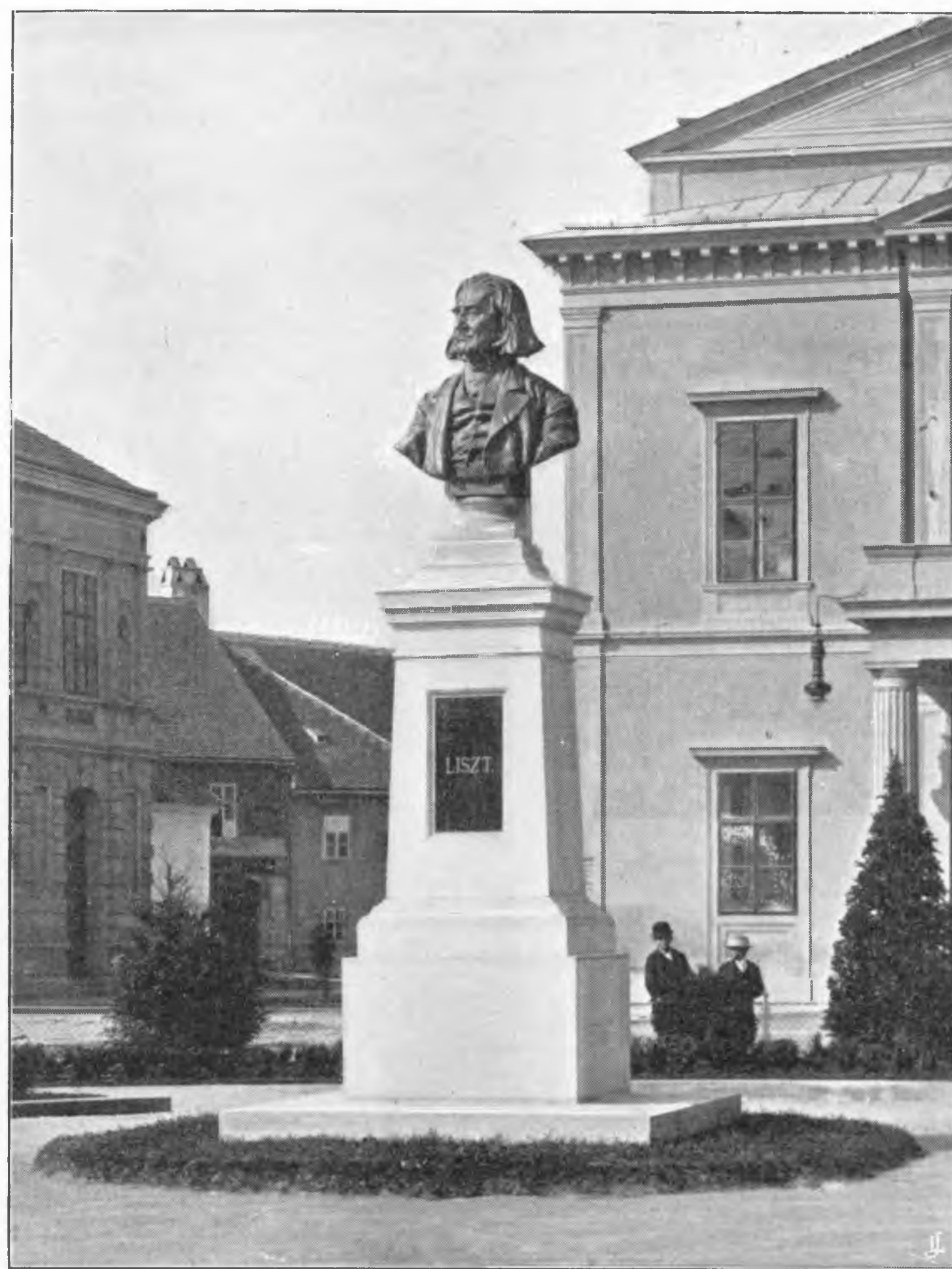
Liszt-Denkmal in Oedenburg.