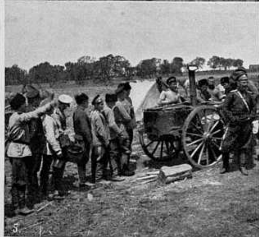
3-я сотня 1-го оренбургскаго каз. полка.