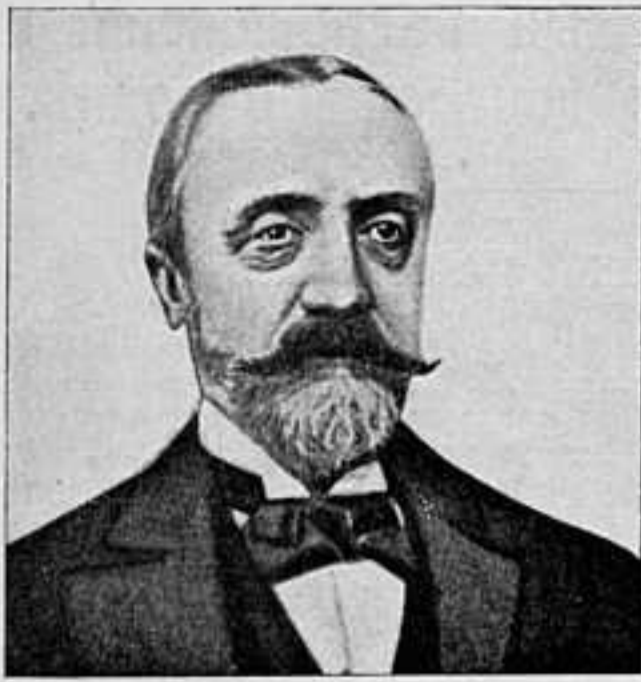
БАРОНЪ Р. Р. РОЗЕНЪ.

Русскій посолъ въ Вашингтонѣ, второй уполномоченный Россіи для переговоровъ о мирѣ съ Японіей.