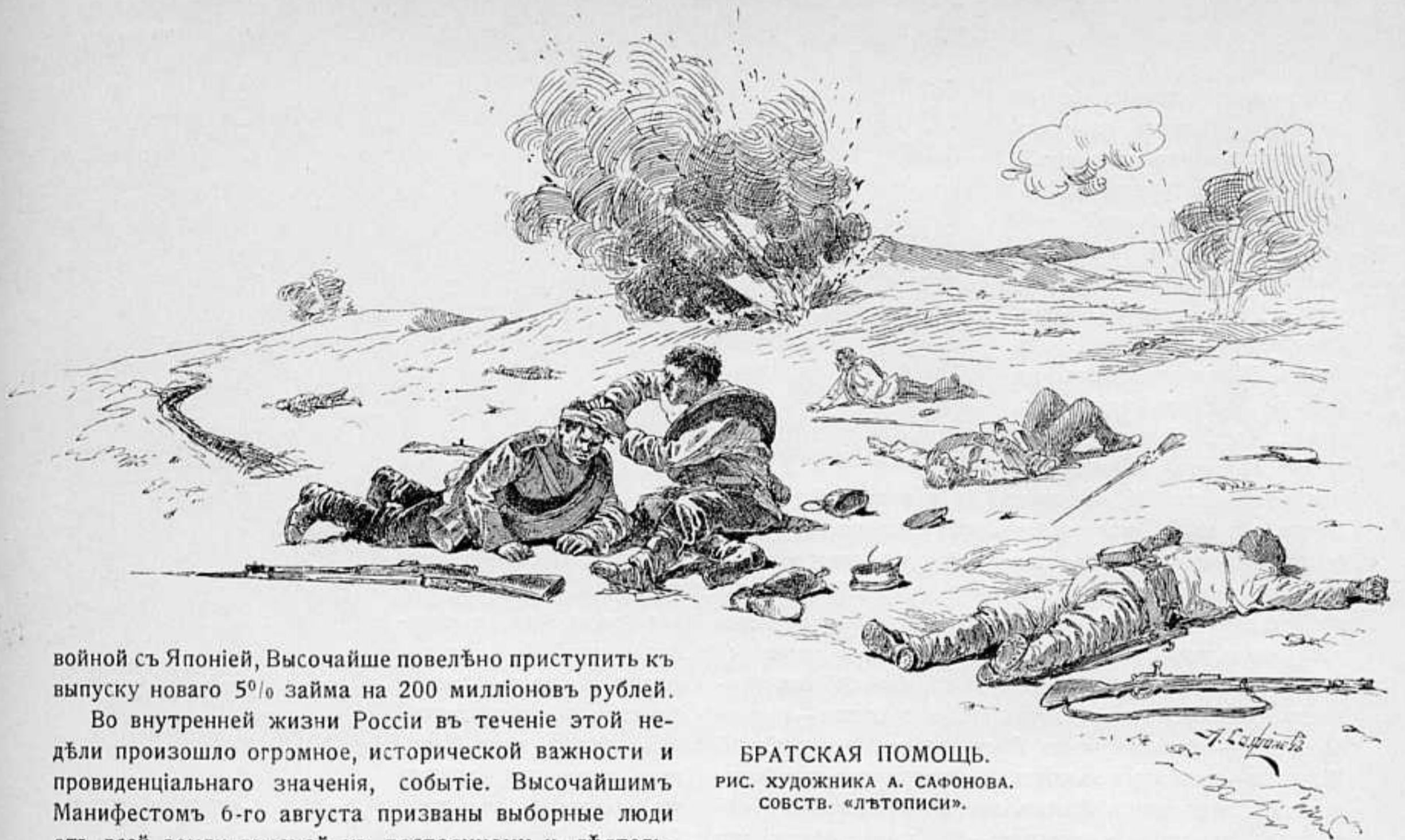
БРАТСКАЯ ПОМОЩЬ. РИС. ХУДОЖНИКА А. САФОНОВА. СОБСТВ. «ЛЪТВОПИСИ».

войной съ Японіей, Высочайше повелѣно приступить къ выпуску новаго 5 0 / 10 займа на 200 милліоновъ рублей.