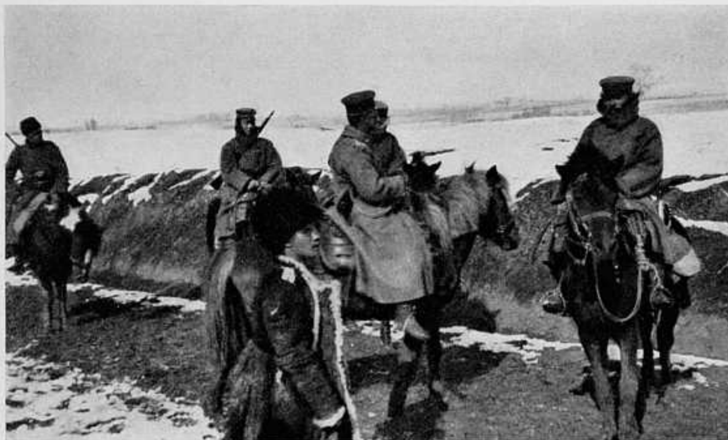
ВСТРѢЧА СЪ НАШИМЪ РАЗЪѢЗДОМЪ ЯПОНСКИХЪ КАВАЛЕРИСТОВЪ, КОНВОИРОВАВШИХЪ ОТРЯДЪ КРАСНАГО КРЕСТА ПОСЛѢ ОСТАВЛЕНІЯ МУКДЕНА.