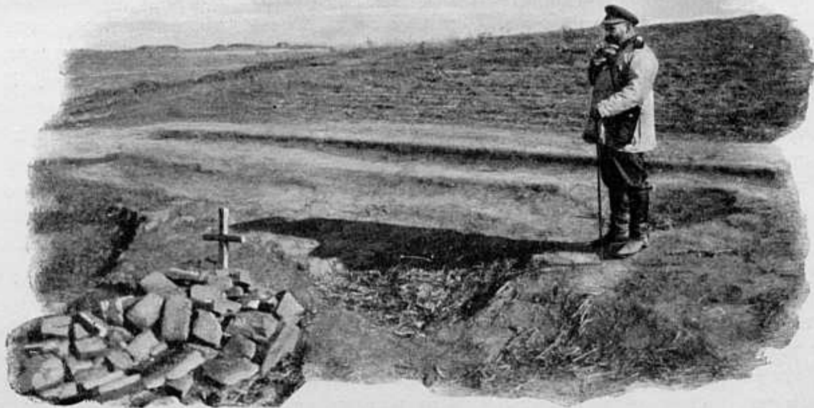
ГЕНЕРАЛЬ ПУТИЛОВЪ У БРАТСКОЙ МОГИЛЫ.

нія съ нашей стороны дѣйствительно послѣдовалъ отказъ. Однако его не получили. Видимо, цѣня возможность прійти къ соглашенію, баронъ Комура предложилъ все-таки по-статейно обсудить желанія Японіи. И обсужденіе началось. Въ головѣ ихъ стояло то, которое и было предлогомъ и поводомъ войны: протекторатъ Японіи надъ Кореей. И характерно то, что