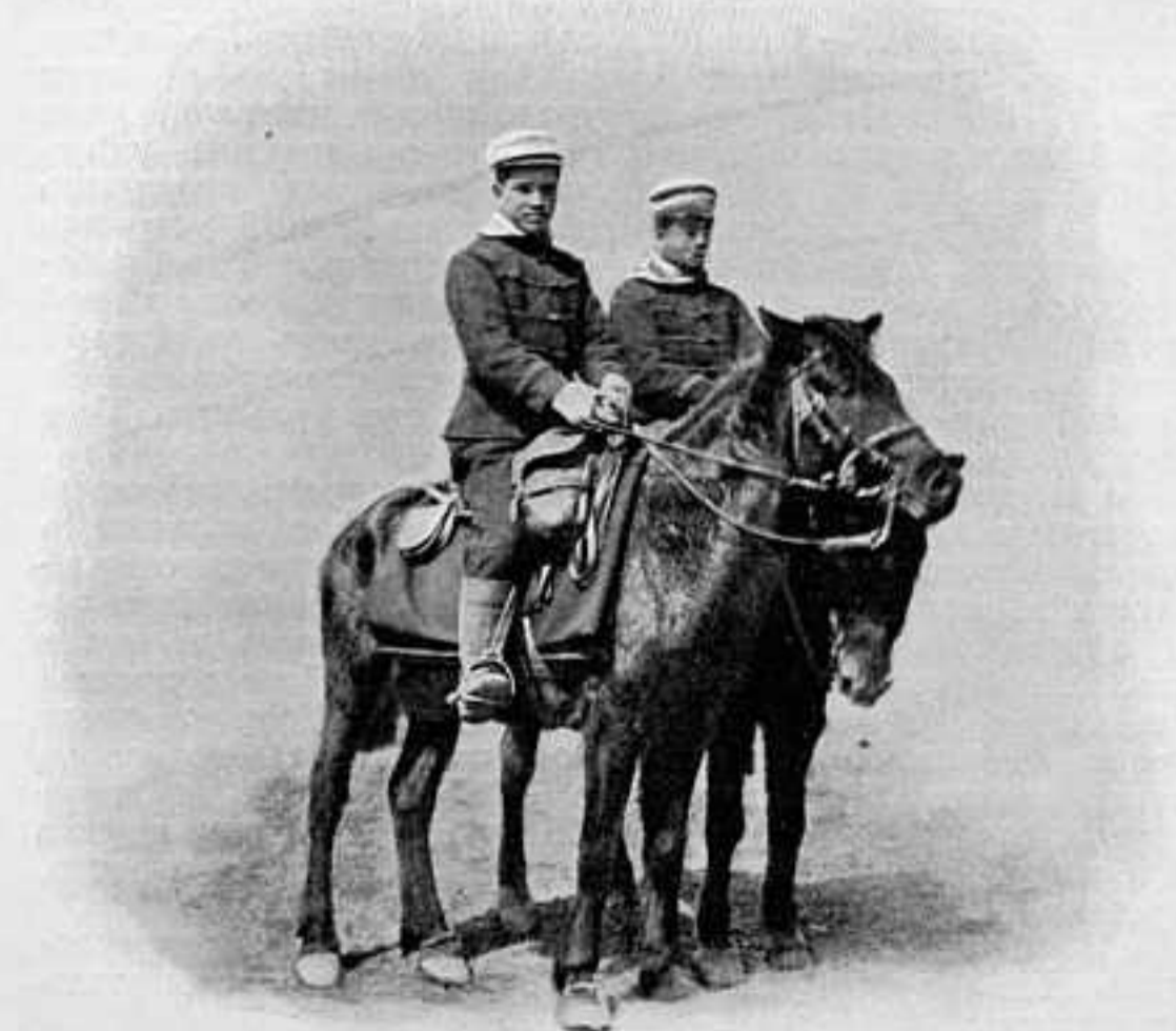
ЯПОНСКІЕ ДРАГУНЫ.

Приказъ по в. в. № 495—о столовыхъ деньгахъ шт.-офицерамъ и капитанамъ артиллеріи, командируемымъ въ перемѣнный составъ передов. артиллер. запаса Маньчжурскихъ армій.