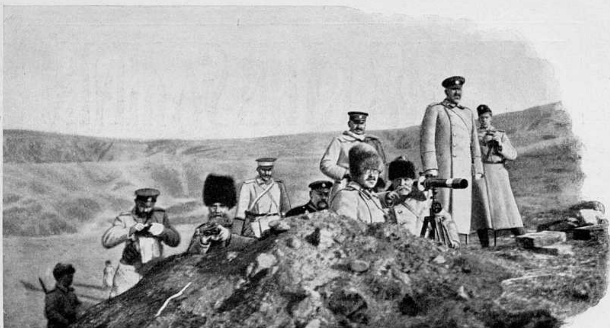
ГЛАВНОКОМАНДУЮЩІЙ НА ПОЗИЦИИ.