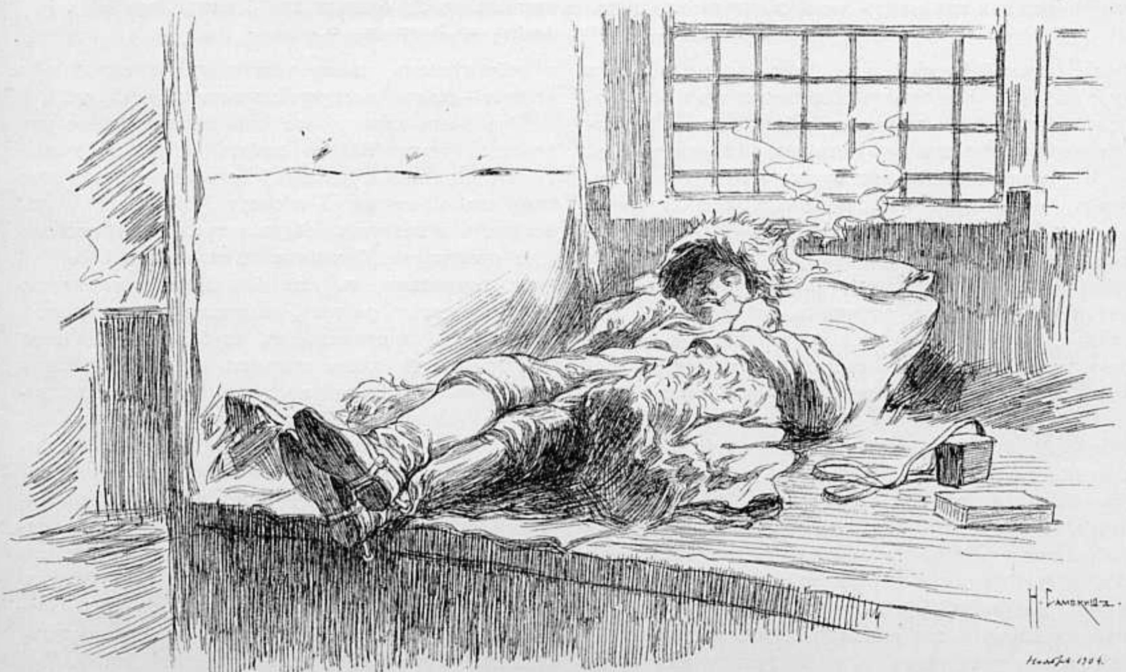
ОТДЫХЪ. РИС. АКАД. Н. САМОКИША.

Смотрю, по перрону, слегка прихрамывая, опираясь на трость, ходить взадъ и впередъ невысокій плотный генералъ... Изъ подъ плотно надѣтой на голову черной папахи видны сивыя густыя старческія