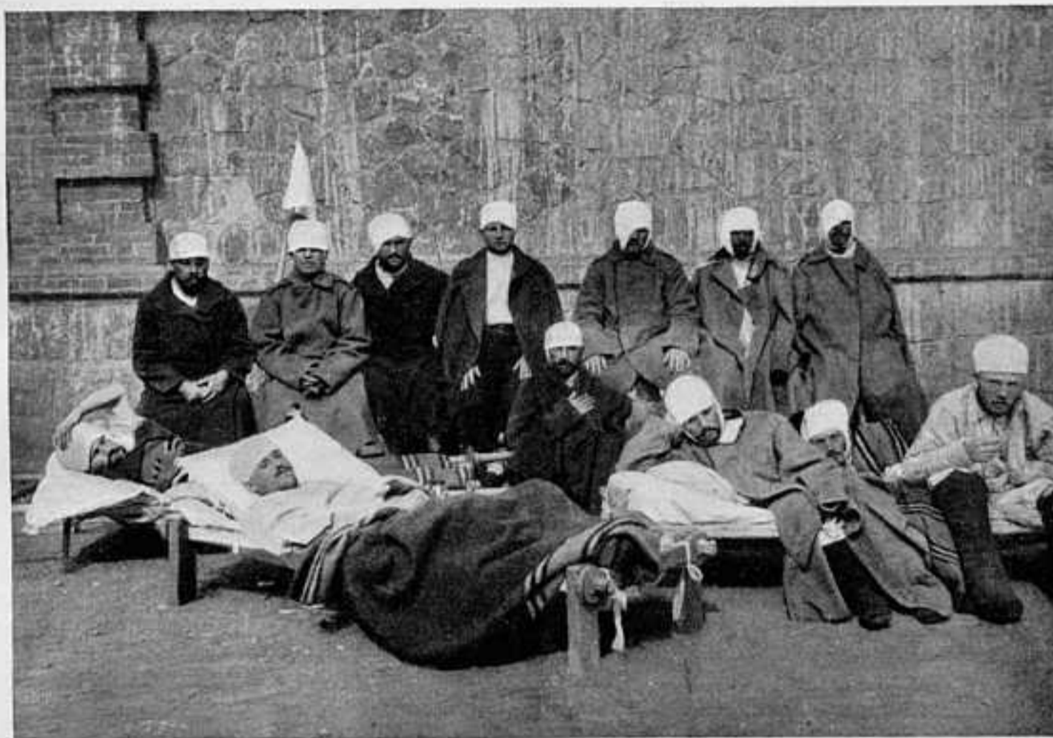
ПОСЛѢ МУКДЕНСКАГО БОЯ.

Вмѣстѣ съ симъ повелѣли Мы министру внутреннихъ дѣлъ безотлагательно представить Намъ къ утвержденію пра-