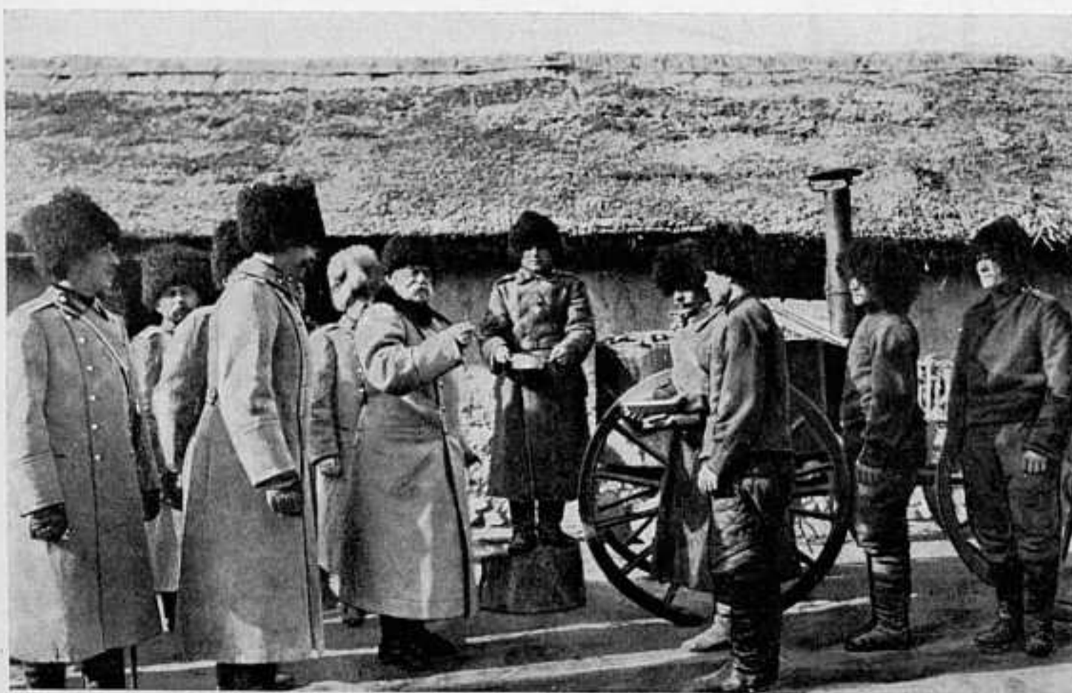
ГЛАВНОКОМАНДУЮЩІЙ ПРОБУЕТЪ ПИЦЦУ.

Для дальнѣйшаго подкрѣпленія средствъ государственнаго казначейства, необходимыхъ на покрытие расходовъ, вызванныхъ