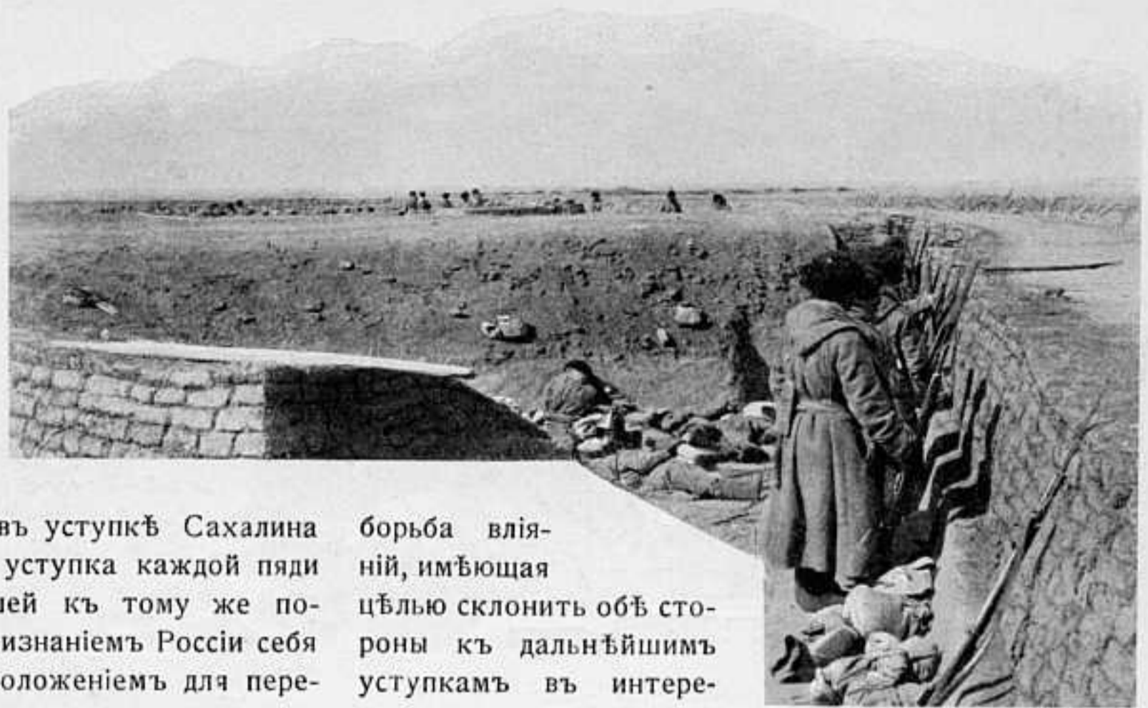
РЕДУТЪ ВЕЛИКОЛУЦКАГО ПОЛКА.

Эго вѣра и продиктовала С. Ю. Витте его гордые отвѣты, за которыми стоитъ вся Русь. Переговоры еще не прерваны, но засѣданія приостановлены съ 5-го по 9-е августа. Въ теченіе этихъ дней идетъ