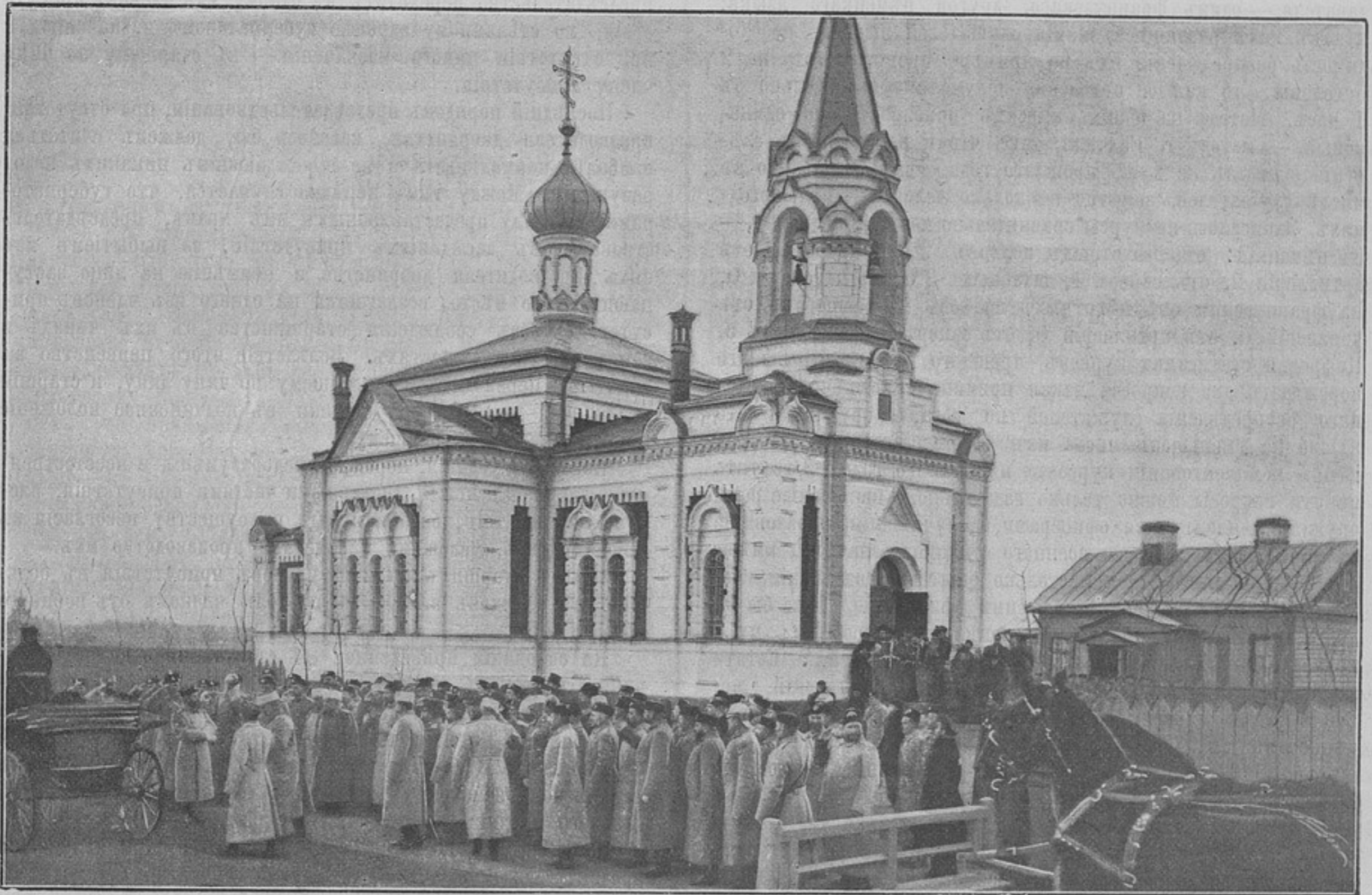
Отѣздъ Его Императорскаго Величества Государя Императора (къ статьѣ «Освященіе церкви на Преображенскомъ кладбищѣ».)

какъ своимъ роднымъ. Въ назначенный день собрались всѣ записавшіеся и, по степени знакомства съ языкомъ, были разбиты начальникомъ штаба округа на 2 группы: одну составили офицеры, окончательно забывшіе нѣмецкій языкъ или начинающіе изученіе его съ азбуки, другую,—офицеры настолько знакомые съ нимъ, что при помощи лексикона могли переводить незамысловатыя статьи. Каждое отдѣленіе было ввѣрено отдѣльному преподавателю. Военное собраніе обязалось доплачивать учителямъ недостающую отъ слушателей плату (каждый изъ учителей получалъ за урокъ 5 рублей) и безвозмездно снабжать во время уроковъ перьями, карандашами, чернилами и бумагой. Начались и курсы. Прежде всего оказалось, что изъ записавшихся 68 офицеровъ, на первый же урокъ явилось только 39; это вполне понятно: многіе записались не ради науки, а желая понравиться начальству, которое быть можетъ посмотритъ на это милостивымъ окомъ. На дальнѣйшихъ урокахъ цифра слушателей колебалась различно, но шла настойчиво къ уменьшенію, такъ что послѣ новаго года въ каждомъ отдѣленіи имѣлось