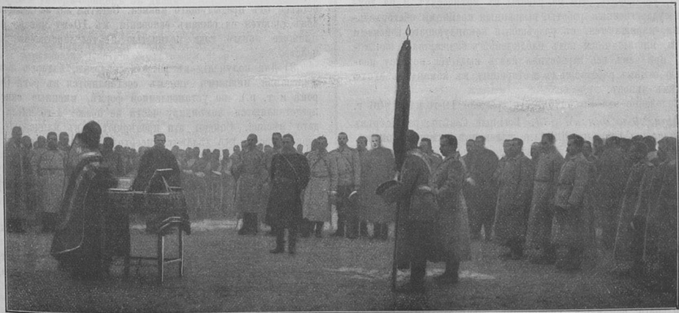
Напутственный молебенъ 11-му пѣх. Псковскому полку, передъ выступленіемъ въ походъ на зимнія квартиры, 15-го октября 1905 г. въ д. Салисипа.