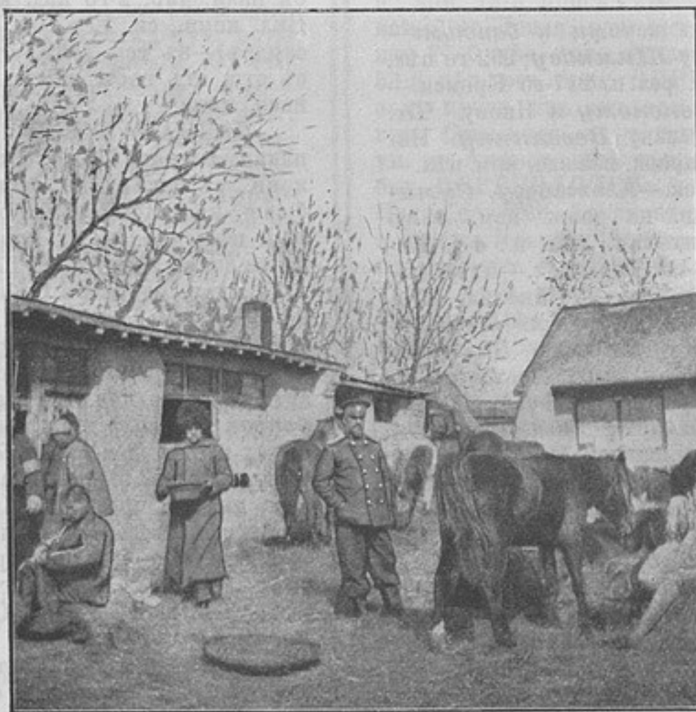
Казачья сотня на границѣ Монголіи.

Отвѣтъ. На основаніи кн. XV Св. В. П. 1869 г. ст. 907, по редакціи, объявленной въ прик. по воен. вѣд. 1903 г.