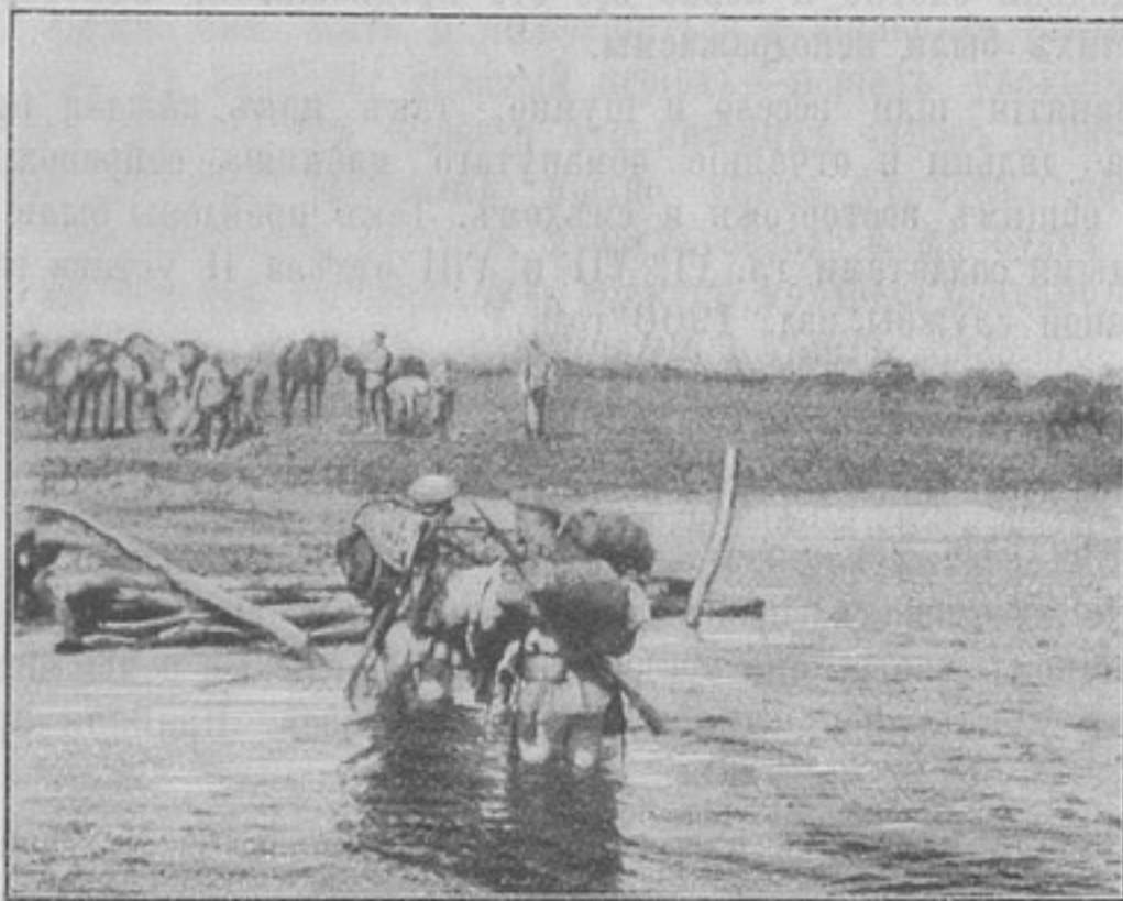
Въ разъѣздѣ.

Нѣсколько разъ порывался я написать объ этомъ самому генералу Драгомирову, но не сдѣлалъ, о чемъ сожалѣю.