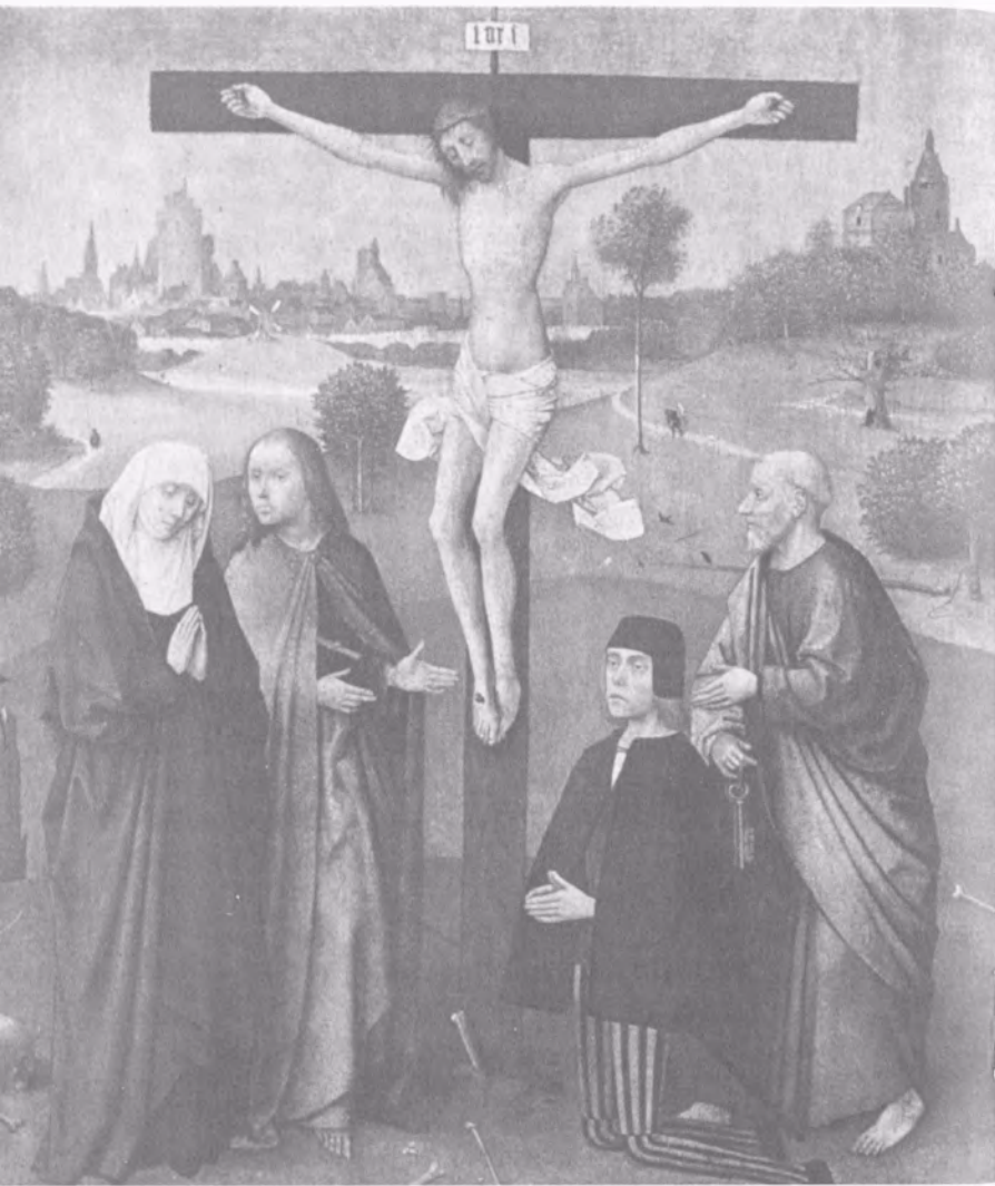
Christus aan het kruis, Hieronymus Bosch