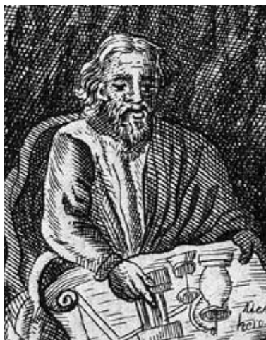
Heron von Alexandria (1. Jahrhundert n.C.)

Wir beginnen mit einem motivierenden Beispiel.