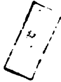
表五 重慶整售物價分類指數