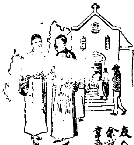
友八勛 韋廉士大醫生紅色補丸

精神爽快體格亦覺豐滿真有却病回春之力鄙人愧 無以報爰助數行藉伸謝忱伏乞登諸報端以告世之 同病者肺癆起病之由往往因血薄氣衰身體軟弱精 神不振或感冒風寒因傷風咳嗽間起或居住低陋潮 濕房屋或切近患肺癆症者同居同食傳染之故韋廉 士大醫生紅色補丸能免癆症實因此丸具有速生新 血輸入腦筋使週身各部強健有力服後能增進體力 使身體血管腦筋強壯有力故可療治肺癆之病原且紅 色補丸亦為婦科各症之聖藥凡 經售西藥者均有出售或直向上海江西路六十號韋廉士大醫生藥局函購每瓶大洋一元 五角每六瓶大洋八元郵力在內 奉送小書 敝局印有名醫康健談小書一本如欲索閱可寄一明信片須註明姓名 住址至上海江西路六十號敝藥局原班郵送可也