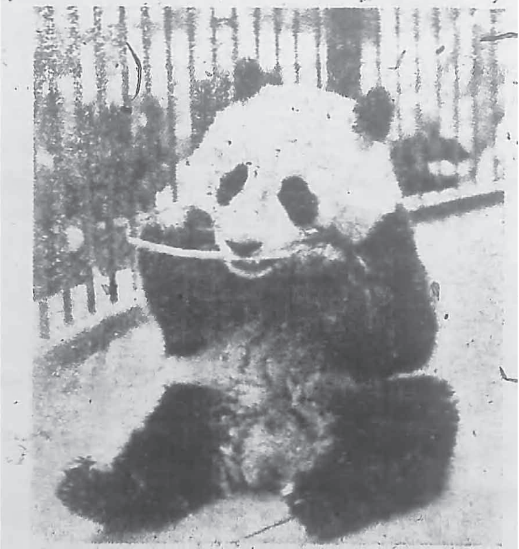
(寄渝自未田)姐小貓熊一又之京至返護渝山博即季秋年本

現在你如果到民社黨辦公室的時侯，你可以首先欣賞到他們那和房東一段長期鬧爭的勝利品——電話機了。