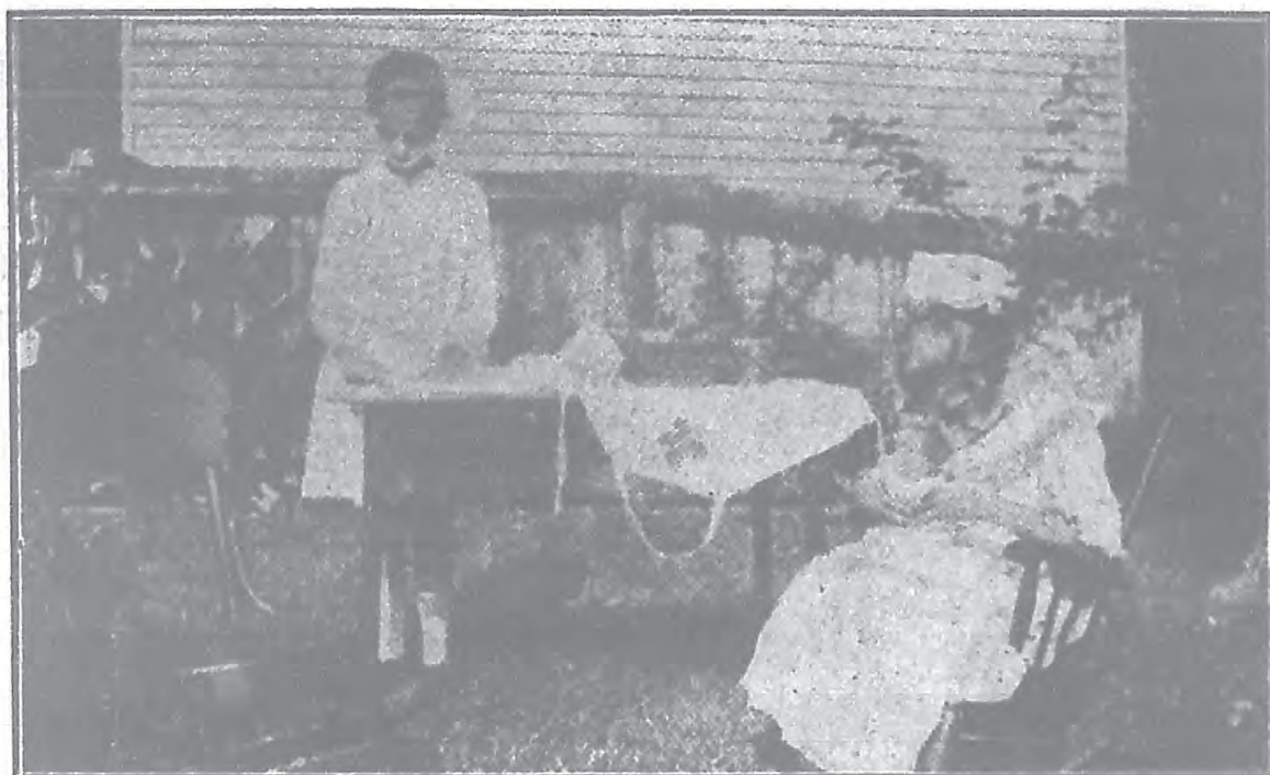
(4) 麥的生鎮戴氏姊妹 家庭設計 (自製長衫)