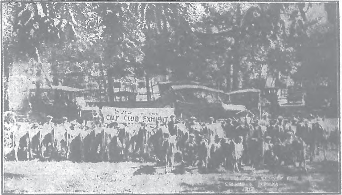
(1) 美國巴爪羅妙縣 兒童養牛設計展覽會