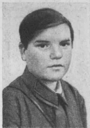
看 護 夫 科 潤 諾 娃