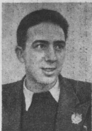
志同里魯巴易、士伊魯

這位西班牙青年，富於自尊心而愛好自由民族子弟，從幼年時代就已將自己的生命獻給於偉大和正義的事業，——獻給為勞動人類爭取自由的鬥爭，為反對血腥法西斯主義黑暗勢力的鬥爭了。