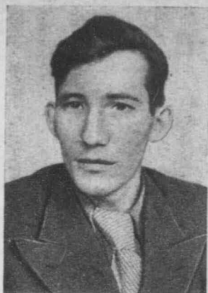
治 奇 鋼 爾 工 科 人 夫