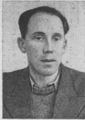
年青的義主斯西法反國德 烈 麻