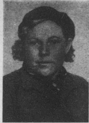
科 康 拜 普 因 寧 機 科 師 娃

科普寧科娃是莫斯科省拉明斯克耕種機站青年女康拜因機師。在偉大保衛祖國戰爭的時日，她在其成千成萬女友隊伍中佔了駕駛康拜因機的位置。