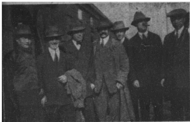
(氏萬爲人二第首左)俄赴途首日七月三年一一九一