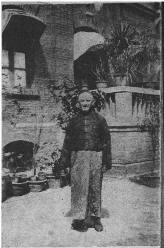
東裝的時軍將霖作張見進「京北」在者作