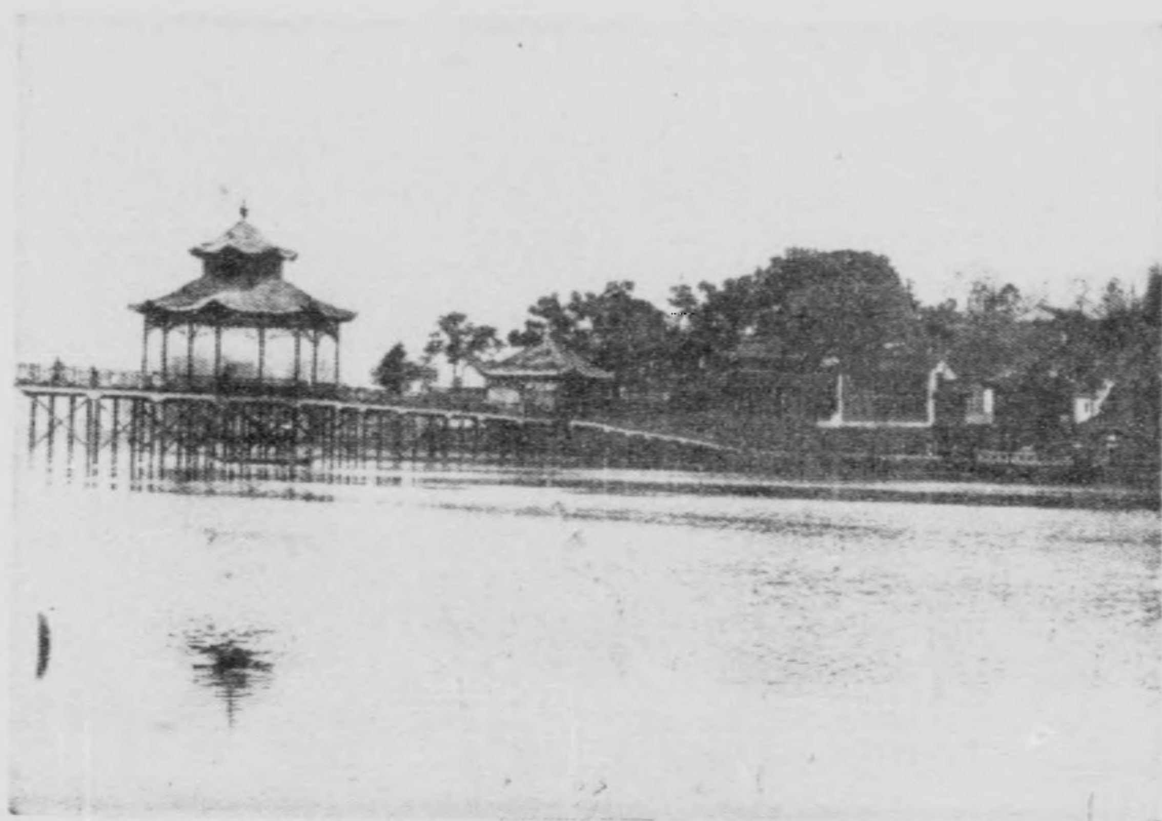
杭州西湖博覽會橋