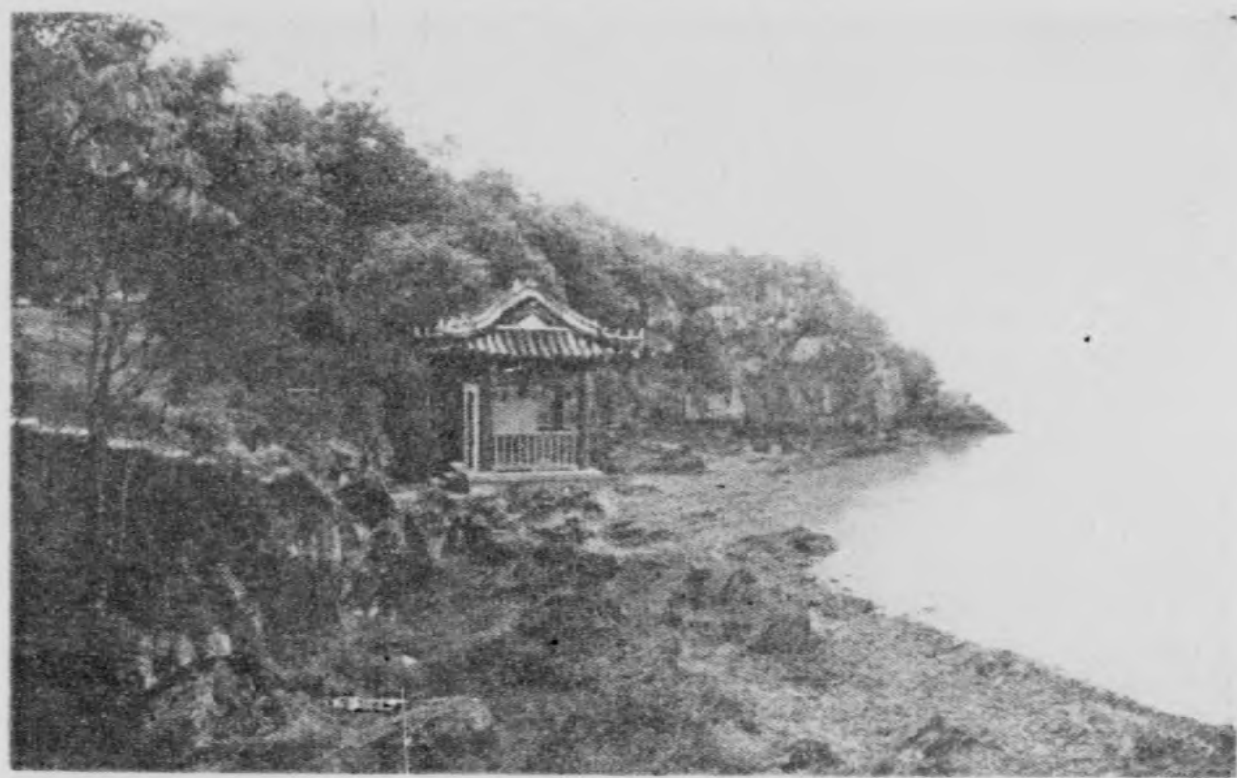
無錫 鼈頭 渚