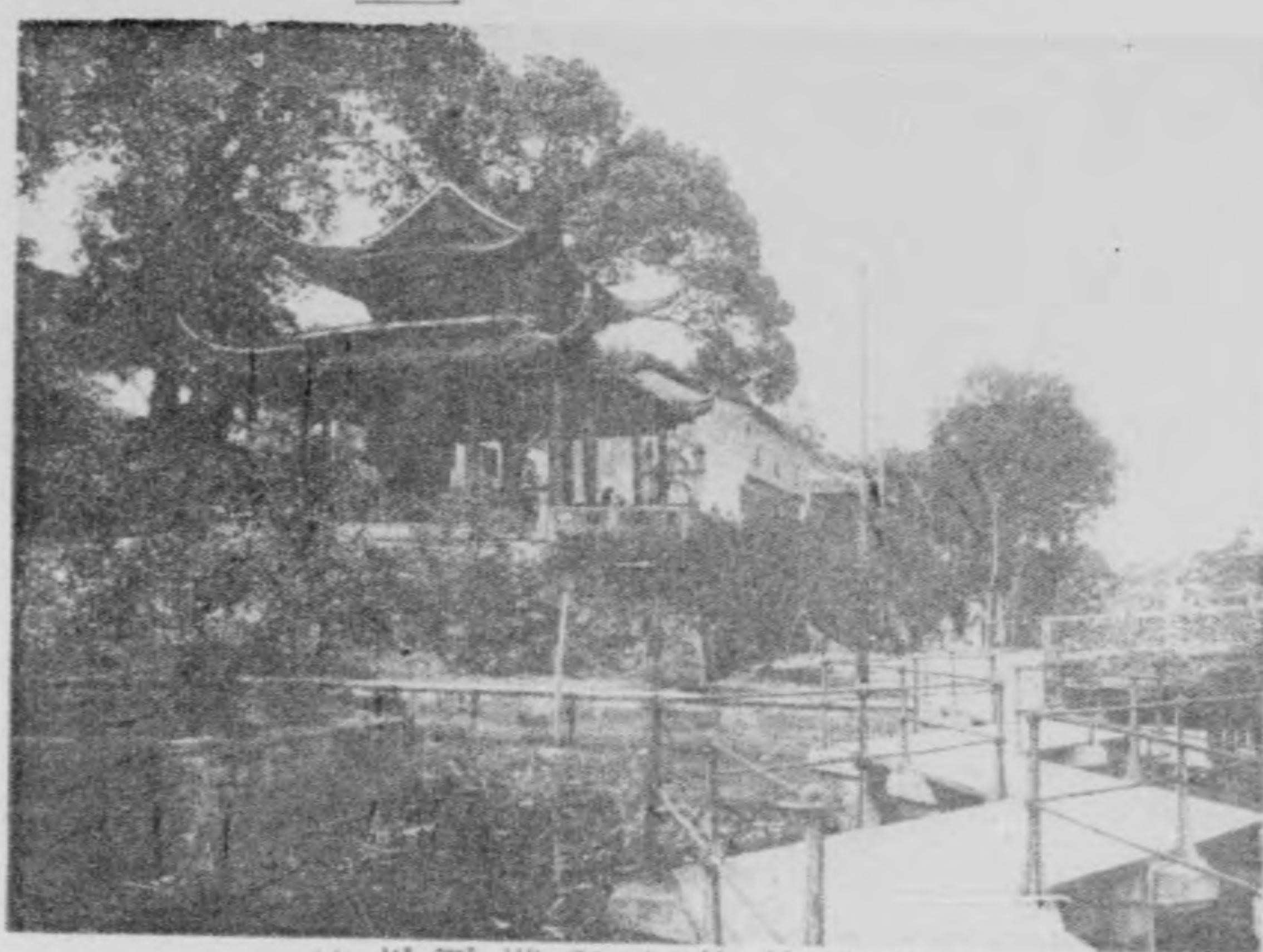
杭州西湖孤山放鶴亭梅林