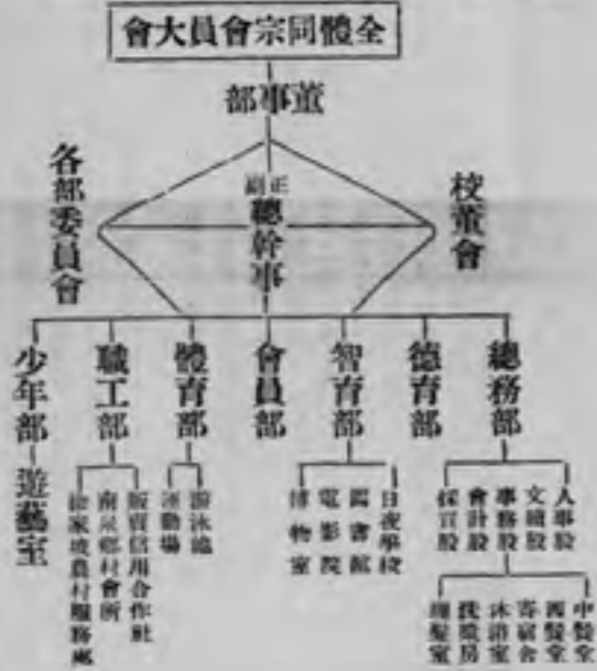
表統系織組會年青教督基華中市慶重