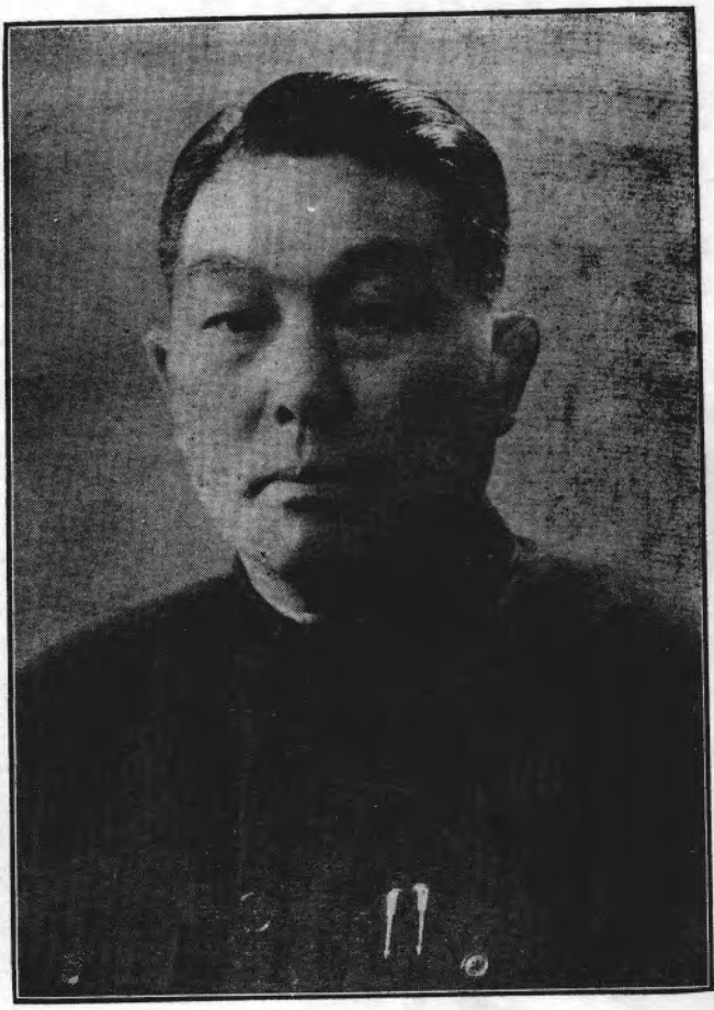
楊 主 席 肖 像