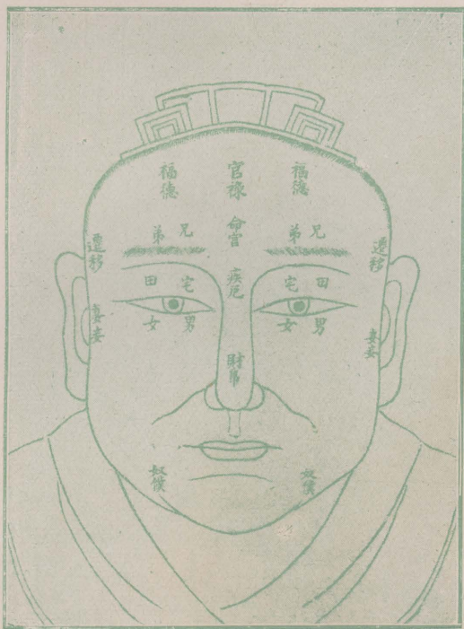
圖 分 宮 二 十