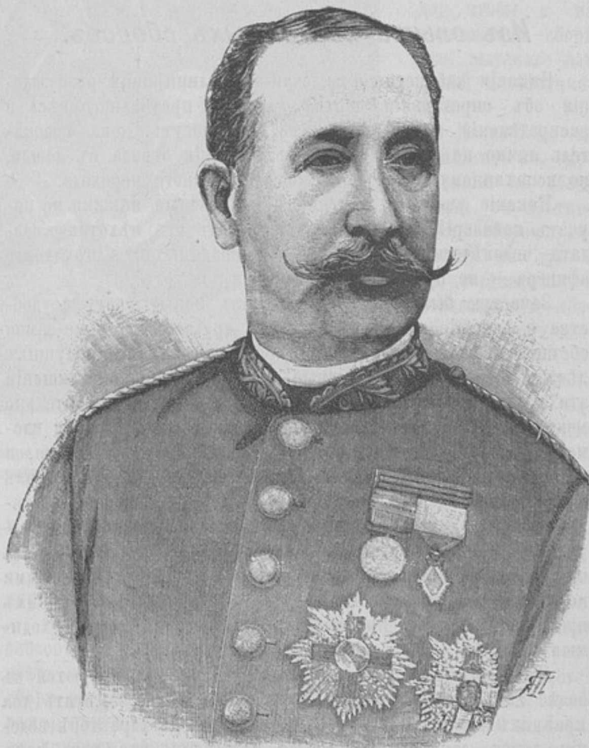
Генераль Мануэль Масіасъ-и-Касадо.

Утромъ 28-го капитанъ генеральнаго штаба Пиказо выѣхалъ изъ Кавреризасъ и проскакалъ подъ огнемъ въ городъ; здѣсь немедленно нагрузили транспортъ и подъ прикрытіемъ саперъ отправили его къ фортамъ. Огнемъ и штыкомъ приходилось саперамъ пробивать себѣ дорогу. Не менѣ кабиловъ задерживали ходъ транспорта мулы, которые боялись выстрѣловъ.