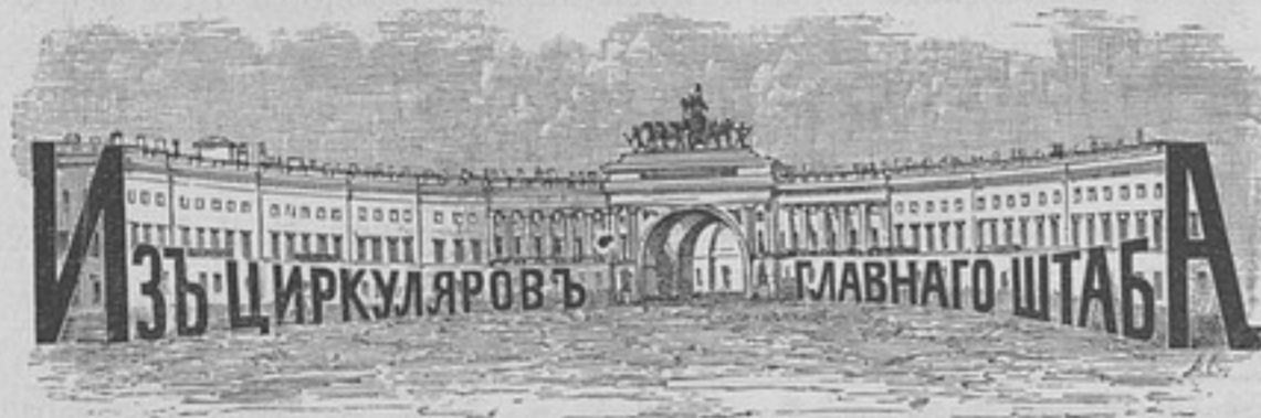
10 января 1894 года, № 8. Расписание рейсовъ пароходовъ Добровольнаго Флота на 1894 годъ.

славской губ. Воспитывался въ Петровскомъ-Полтавскомъ кадетскомъ корпусѣ, затѣмъ поступилъ во 2-е Константиновское военное училище, изъ котораго перешелъ въ Михайловское артиллерійское училище. Въ 1865 г. выпущенъ подпоручикомъ во 2-ю резервную конно-артиллерійскую бригаду. Въ 1872 году за успѣшное окончаніе Николаевской академіи генеральнаго штаба произведенъ въ капитаны, а въ слѣдующемъ году назначенъ старшимъ адъютантомъ штаба 2-й гвардейской кавалерійской дивизіи. Въ 1876 году назначенъ и. д. штабъ-офицера для порученій при штабѣ войскъ Гвардіи и Петербургскаго военного округа, въ слѣдующемъ году произведенъ въ подполковники. Въ полковники произведенъ въ 1878 году, за отличія противъ турокъ въ сраженіи подъ Филиппополемъ 3-го, 4-го и 5-го января этого года. По окончаніи турецкой кампаніи, въ теченіе которой, кромѣ другихъ знаковъ отличія, былъ награжденъ орденомъ Св. Георгія 4-й степени за отличія въ дѣлахъ при переходѣ черезъ Балканы и въ бою подъ Ташкиенемъ 19-го декабря 1877 г., состоялось назначеніе начальникомъ штаба 1-й гвардейской кавалерійской дивизіи, а въ 1888 году—командиромъ 7-го драгунскаго Новороссійскаго полка. Въ 1891 г. произведенъ въ генераль-маіоры, съ назначеніемъ начальникомъ штаба Ковенской крѣпости, а затѣмъ состоялись назначенія начальникомъ штаба 7-го и 4-го армейскихъ корпусовъ. На занимаемую нынѣ должность назначенъ 20-го ноября 1893 г. Имѣетъ орденъ Св. Владимира 3-й степени.