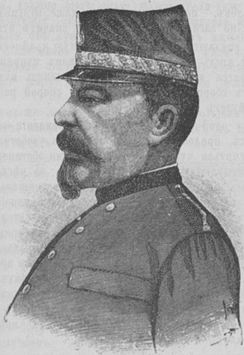
Генераль Мануэль Ортега.

Въ то же время другой отрядъ, въ составѣ полковъ Бурбонъ и Эстремадура и 1 саперной роты двинулся къ фортамъ Верхній Кавреризасъ и Рострогордо, которыхъ нужно было соединить траншеею.