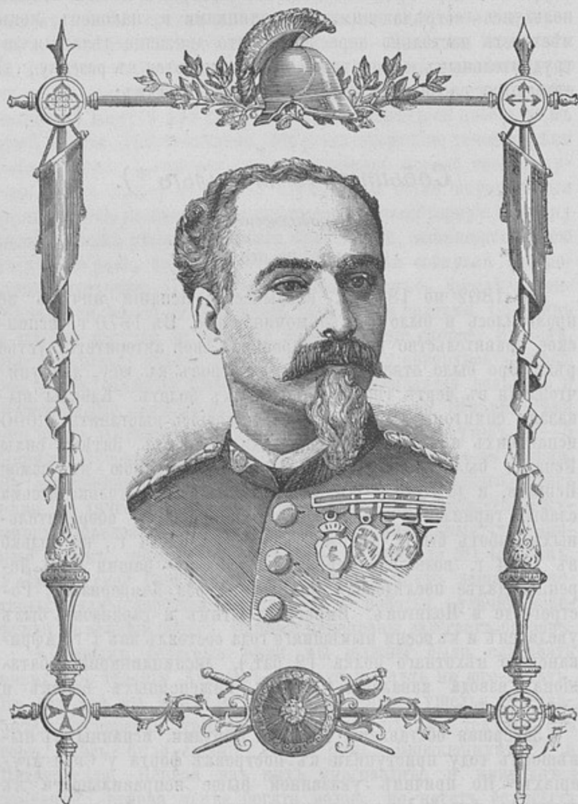
Генераль Хуанъ Гарсія Маргальо.

Въ крѣпости поднялась тревога, и генераль Маргальо выѣхалъ къ форту Камельось.