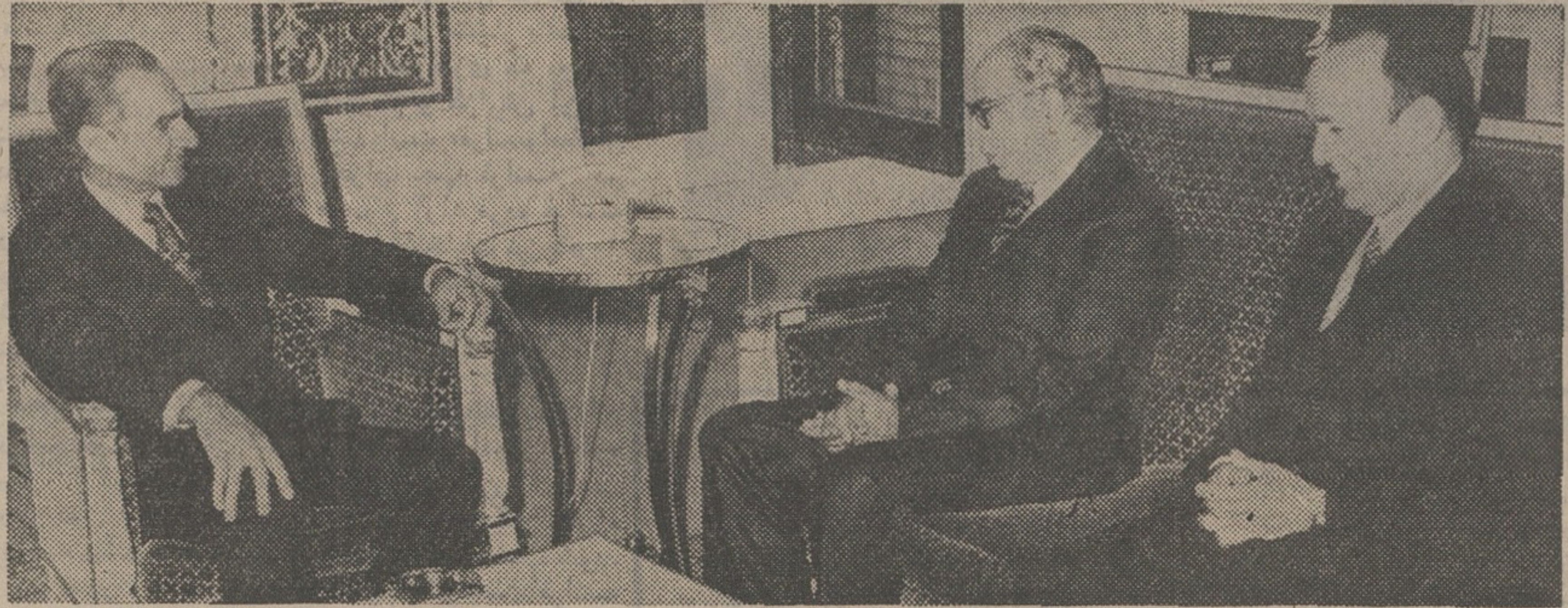
شاهنشاه نایب رئیس مجلس خلق مصر را دیروز در کاخ نیاوران به حضور پذیرفتند . محمد سمیع انور سفیر مصر در تهران مقرر سمت راست « نیرداین شرقیایی افتخار حضور داشت .

قاهره آماده است قراردادی برای تضمین سرمایه ایران منعقد کند گسترش مناسبات ایران و مصر عامل مهم در تفاهم منطقه است صفحه ۱۲ ستون اول