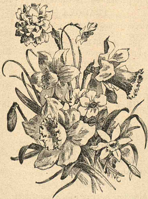
Buchet variat de Narcis. [expl, în'acest No).