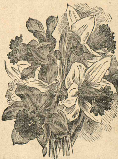
Narcis, „Împăratul și Împărăteasa.” (Etpl. în'acest No