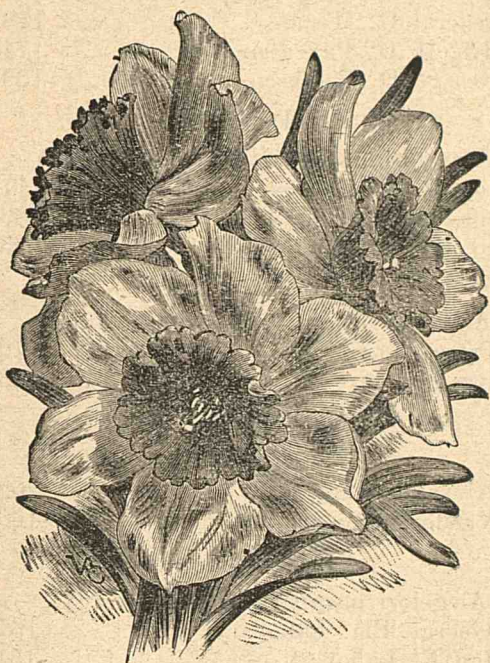
Narcisul incomparabil. (Explicația în'acest No),