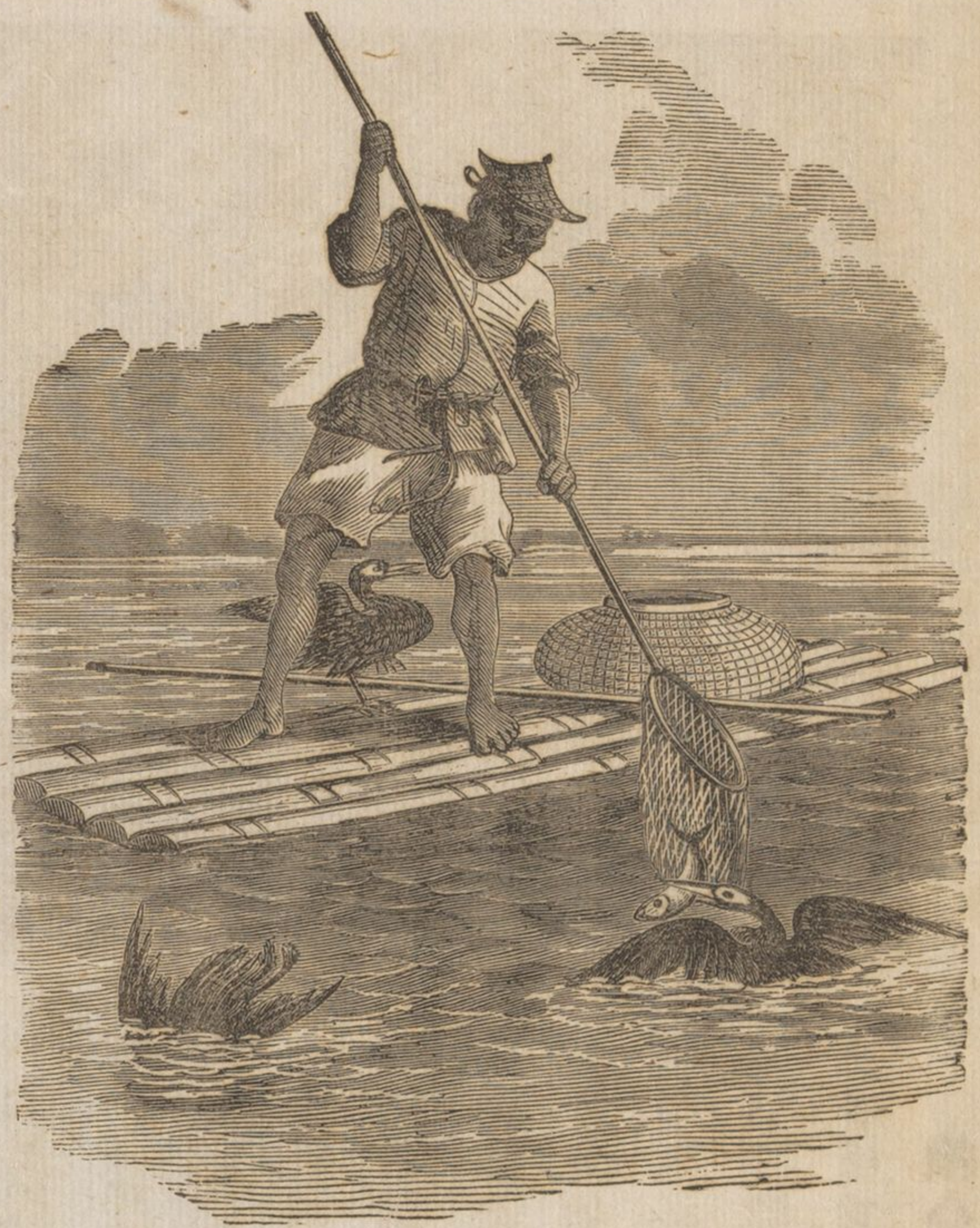
圖 捕 魚

但他丈夫雖然不是信耶穌的 第 人，却在船上，常聽見傳道的先 生講究，也知道一些大畧的道 四 理。於今聽見他女人這些話，也 有一點心軟，但因船要速開，不 能在家久耽擱，故第二日早晨， 就回船去了。哈娜的母親，因覺 着自己罪重，恐終不能免，雖心 誠曾告訴過他，可以求救主赦 免，但又怕去求，救主不肯聽他 的禱告，倒反惹出他的惱怒來， 故此心中十分難過，不知如何方好，乃打發哈娜去叫心誠來問他，可解心中之苦惱。如是哈娜 就到心誠家中，看見心誠帮他母親在家做女工，見哈娜進來，就問道：你來做什麼？哈娜說：自那 天你講道回來，我母親臉上常帶憂愁的樣，一點喜歡的顏色沒有，就是我小妹妹見他，他也是 不喜歡，自這幾天，口裏常說心誠爲何不來，所以今日特叫我來叫你去，不知爲何事，如是心誠