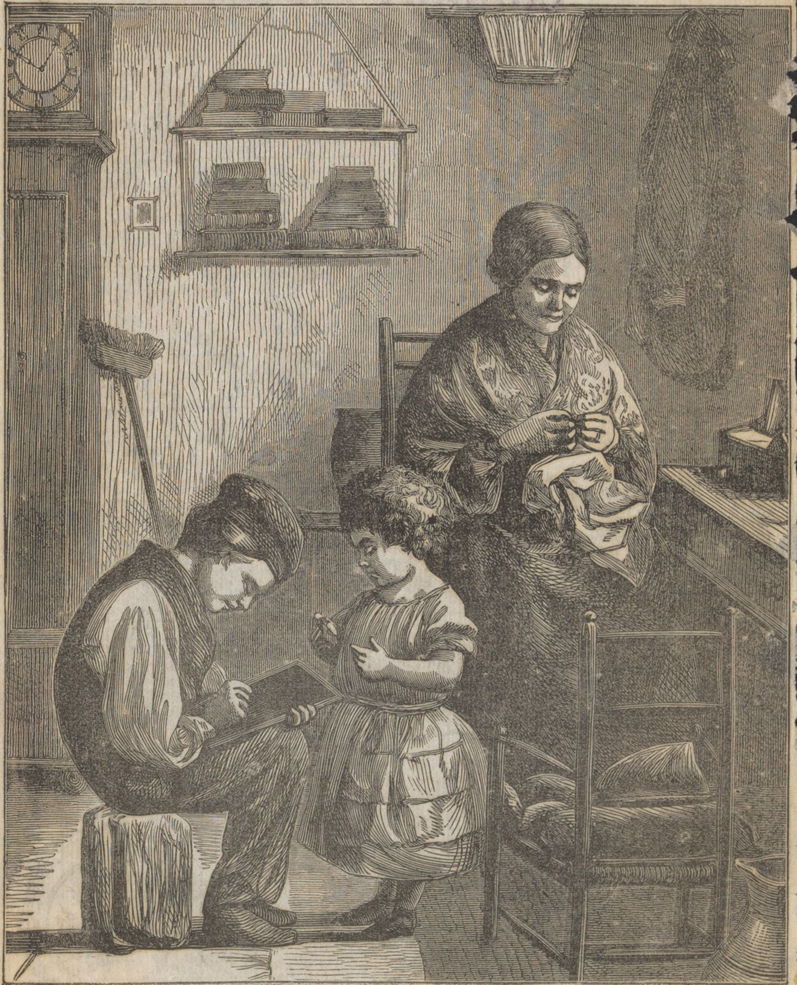
教 子 讀 書