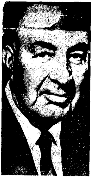
محمد داود، رئیس جمهوری برکنار شده افغانستان - خبر کشته شدن او مکتست درست نباشد

صدها نفر در جنگ شدید تانکها و هواپیماها کشته شدند