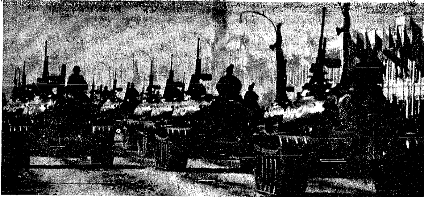
چند واحد از تانکهای افغانستان هنگام رژه در کابل - نمائی از مسجد معروف عیدگاه در عکس دیده می شود