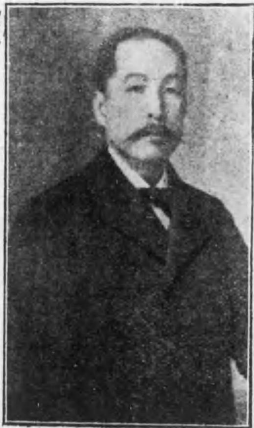
(革井今の代時師牧)

導かれて、貫牧師から洗禮を受けて信者に成た、といふ通知を實妹から得た時の嬉しさは筆にも言にも表はし難き満悦であつた、福音丸の夏季傳道が終へて、徳島市に實妹を訪ねて、私を「罰當り」と罵りし慈母に面會せし時は、實に感慨無量であつた。眞理は最後の勝利」を、私に得させ給ひし神の聖前に、うから、はらからと感謝の集りを開きし時は、喜びの感涙滂沱としの學業を卒へて、大阪バプテズト教會の傳道師となり、後ち按手禮をうけて牧師と成て、慈母を徳島より大阪に迎へて、再び母子同様の欣喜を與へられた。目が潰れるの、口が曲