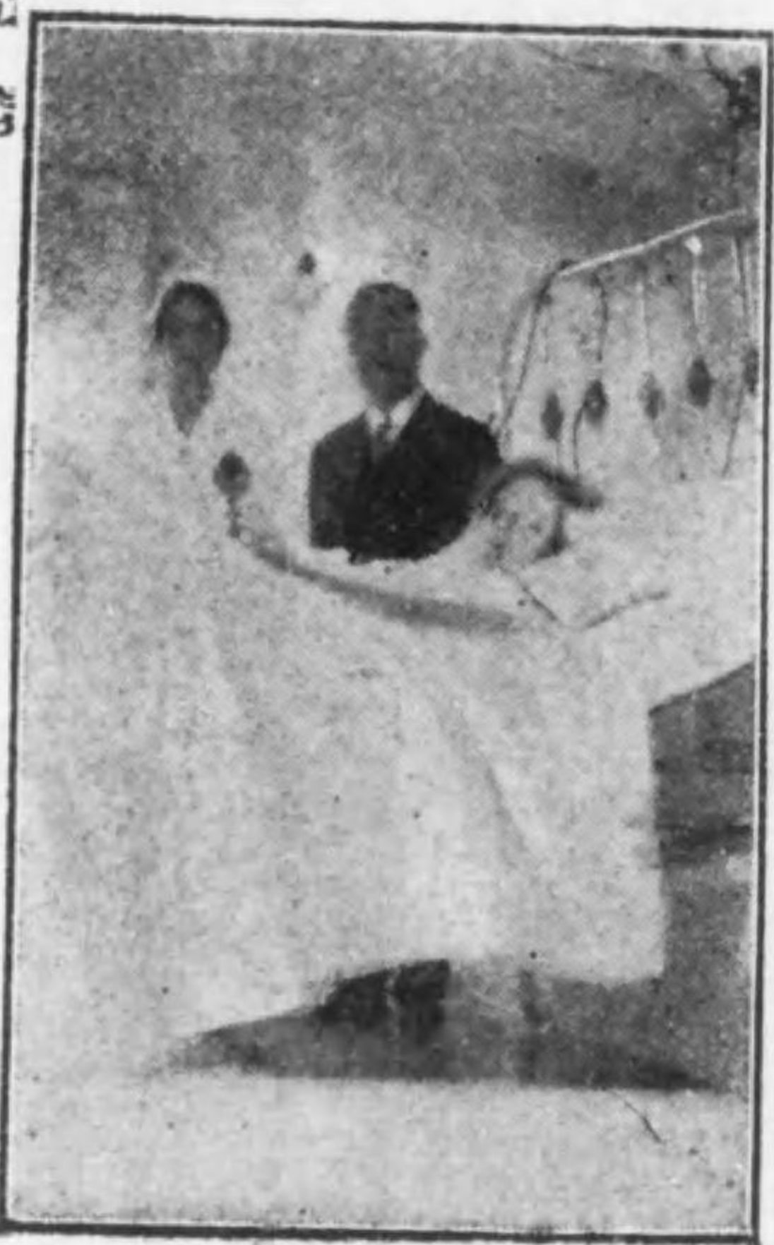
(婦護看・革井今・人夫氏ビ)