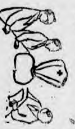
孫科在政治上，正四出活動。

孫科在政治上，正四出活動。其目的在於使國民政府，能更趨於統一。其目的在於使國民政府，能更趨於統一。其目的在於使國民政府，能更趨於統一。其目的在於使國民政府，能更趨於統一。