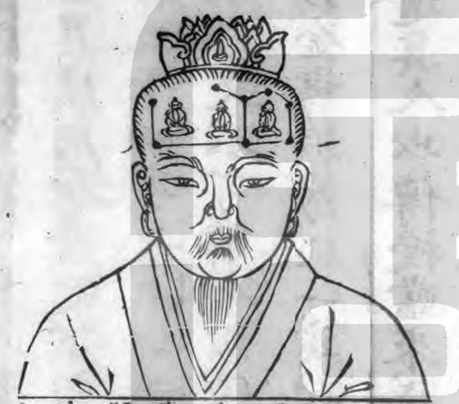
存黃老君 魏神與已 魏對坐赤 子正坐斗 中衣赤繡 華衣如嬰 兒黃老魏 衣黃華繡 衣