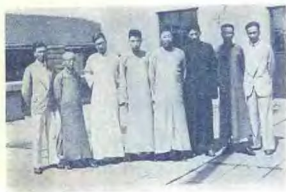
大會工人之一部份