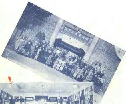
㊟ 世界紅卍字會上海分會