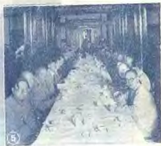
上海市政府歡迎狀 品覽展因