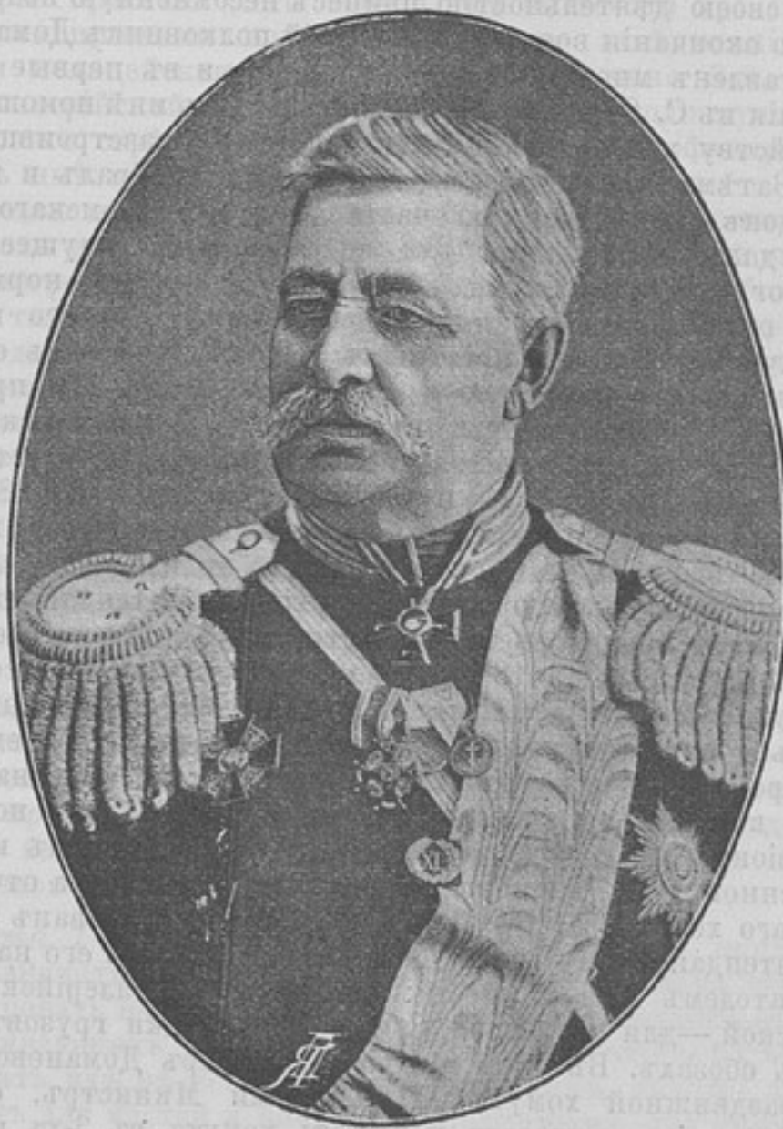
Окружный интендантъ Омскаго военнаго округа, Генераль-Лейтенантъ