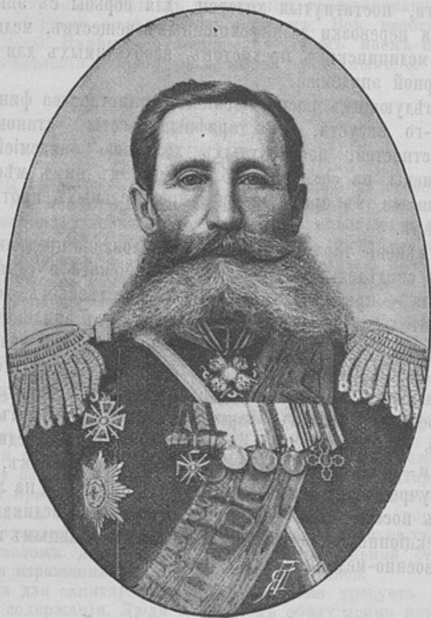
Окружный интендантъ Туркестанскаго военнаго округа, Генераль-Маіоръ