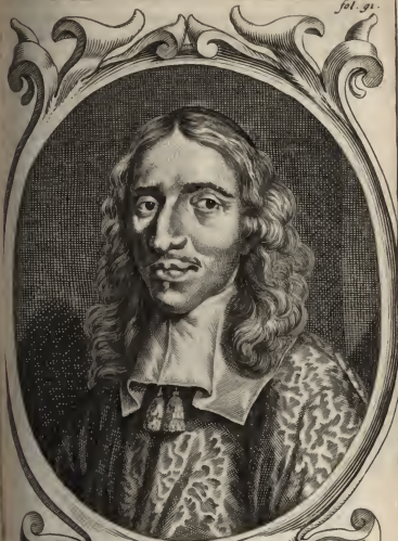
JOHAN DE WITT, Raet-Pensionaris van Hollandt.