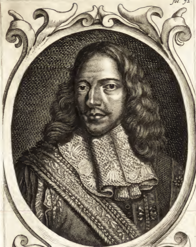
CORNELIS DE WIT, Ruward vanden lande van Putten.