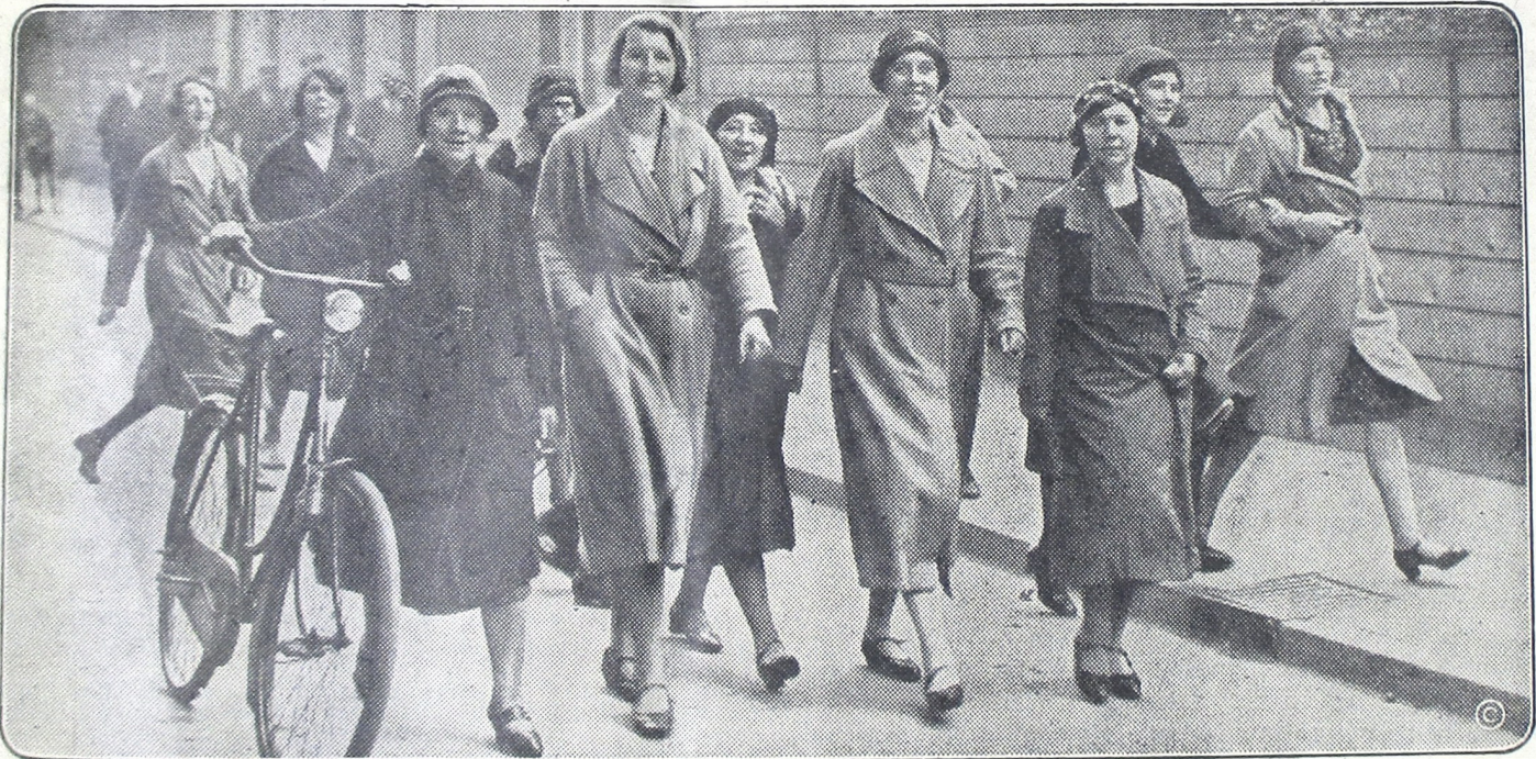
ပုံစံအမျိုးမျိုး Lonneker ရေးဆွဲပေးပါမိန့်

ပုံစံအမျိုးမျိုး ရေးဆွဲပေးပါမိန့် ကြော့ကလေးပုံစံအမျိုးမျိုး ရေးဆွဲပေးပါမိန့် ကြော့ကလေးပုံစံအမျိုးမျိုး ရေးဆွဲပေးပါမိန့်