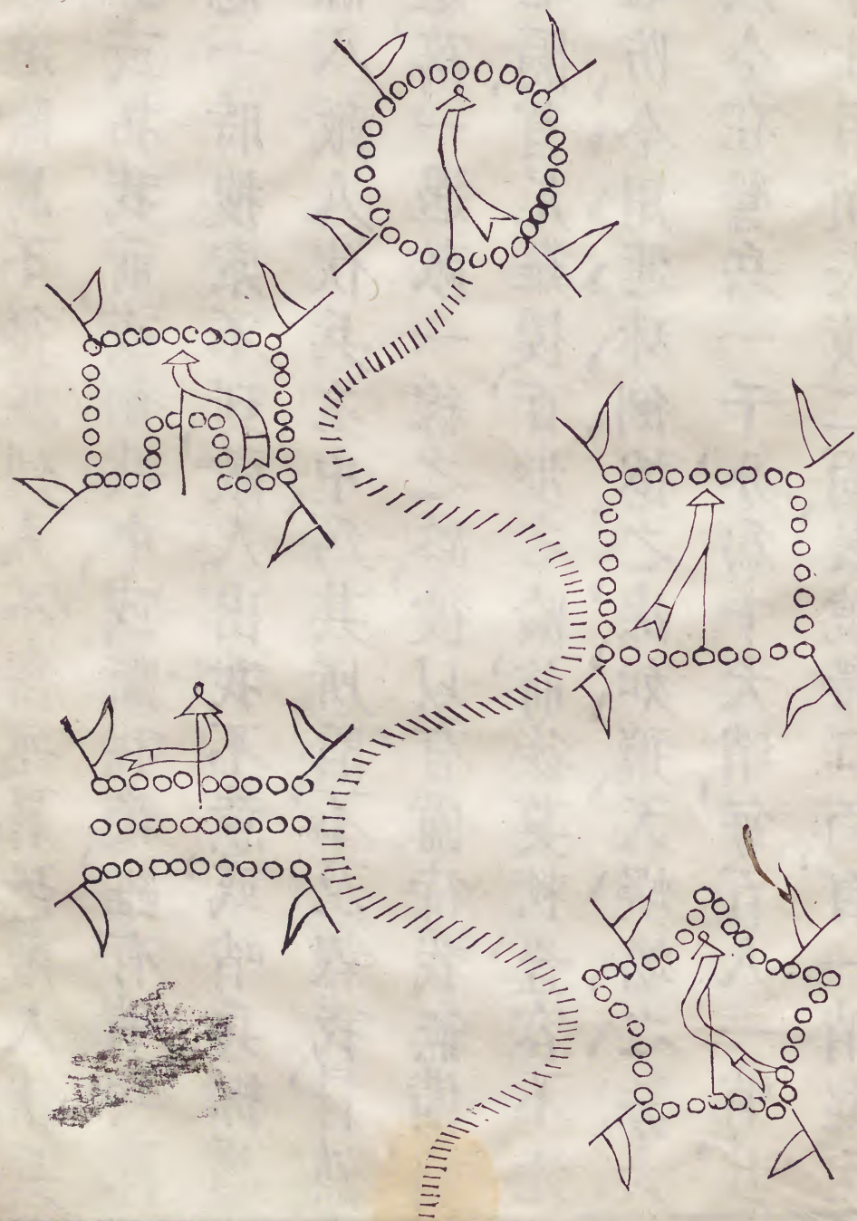
山路險步步行營倒捲疊進圖

詳如無事時方可交鋒凡自寅至戌日行六十里 十里整齊休息三十里會乾糧 撥夜巡止宿處所每司輪撥兵一旗哨官一員各 巡夜其本夜內驚恐火燭奸細之變俱罪坐巡夜 官兵其把總不時親自密查