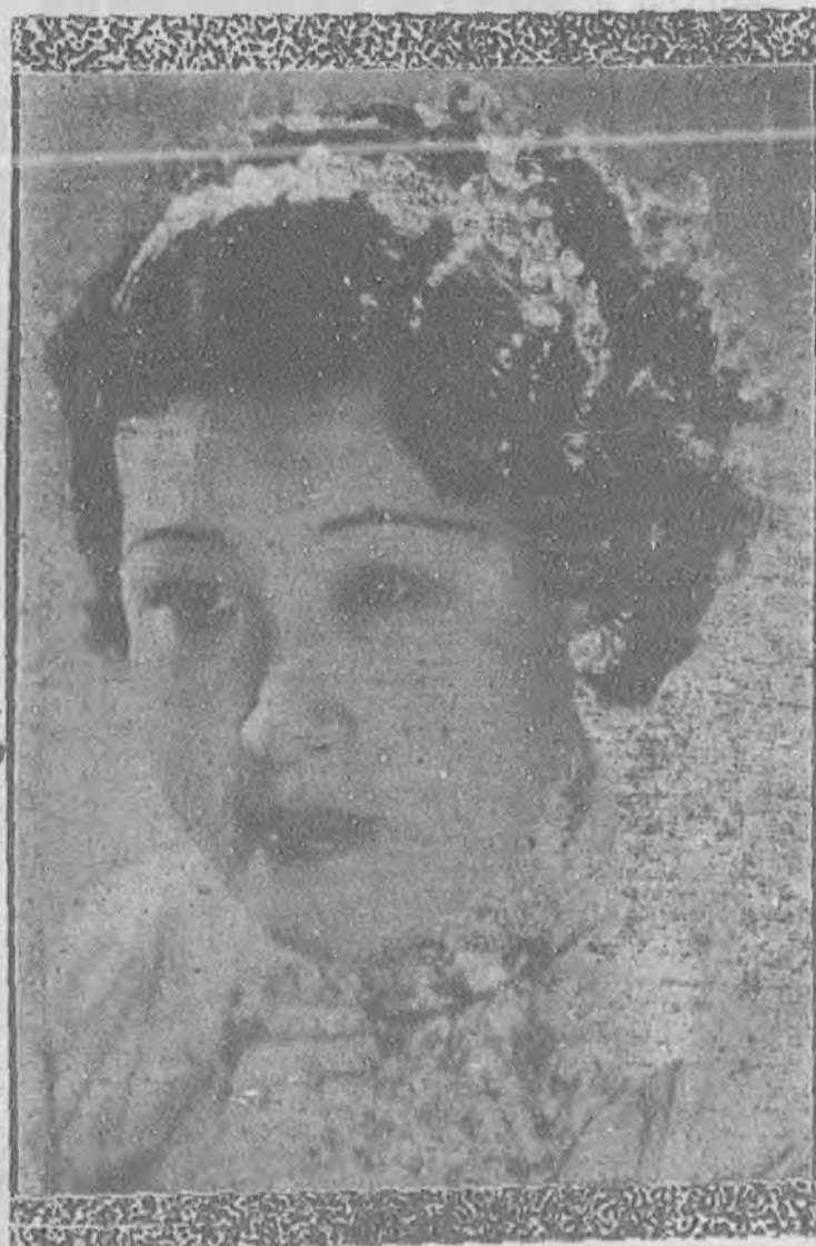
攝館像照元一 姐小信淑李媛名