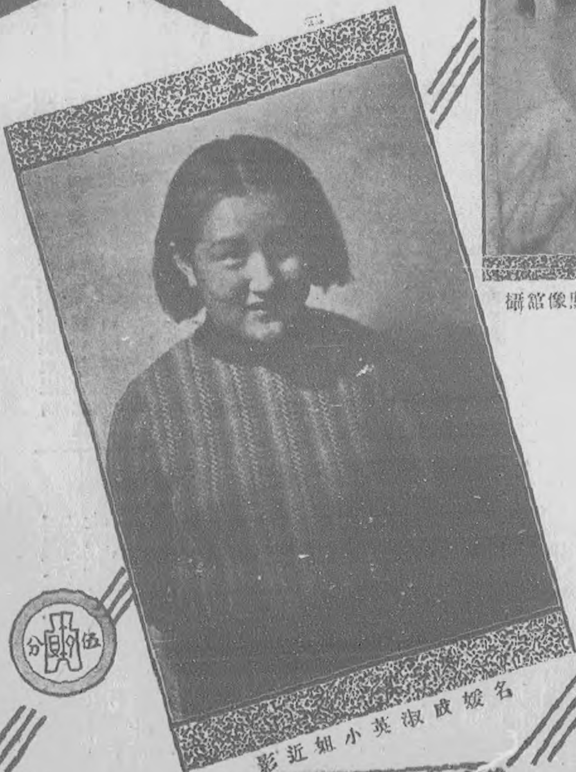
影近姐小英淑成媛名