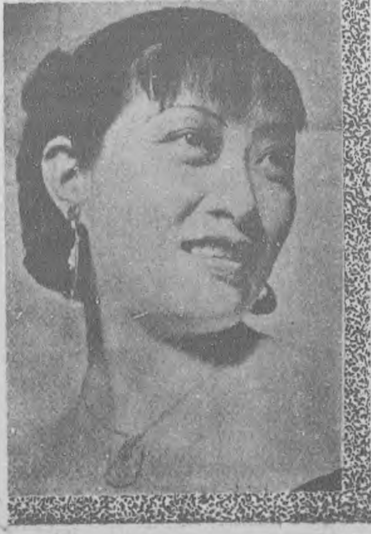
善溜潑辣女子之歲月嫻

無線電影將出世，是必然的現象了，更能替代有聲與無聲影片。雖然柏爾德所試映的無線電影放映的面積是比較現在銀幕小得多，但是將來一定更會把一切不足彌補。至少每個家庭都能接