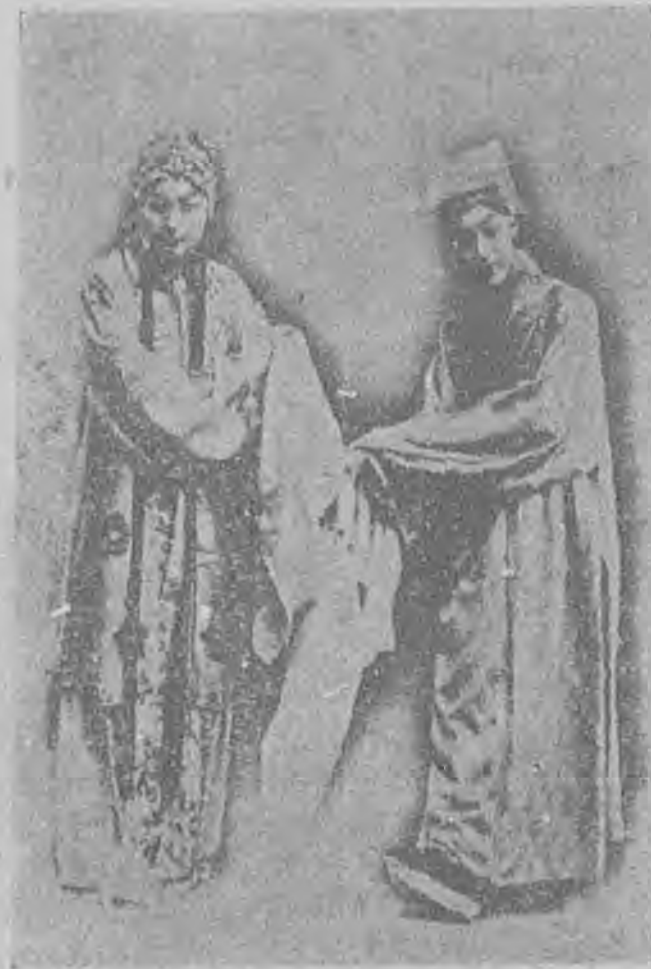
記廣西之利硯程雲小荷

花錢聽戲，這不問可知是不常聽戲人的口吻，可你是你問起他來，也自有他的理由在：「聽戲本是找樂子，有時確恰得其反，當你抱着很大的希望，打算聽或看一句的時候，你所聽到的不是戲，而是台下的說話聲