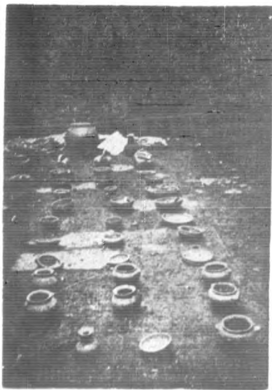
下圖所陳之陶器係磁質為上圖唐墓 中所掘出者除瓶盤等外另有磁竈 (黃爾瞻君贈)