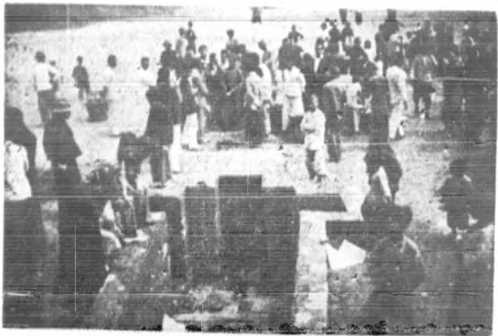
民國廿五年夏間晉江建築運動場所掘出唐代古墳三座 上圖為發現時之情況