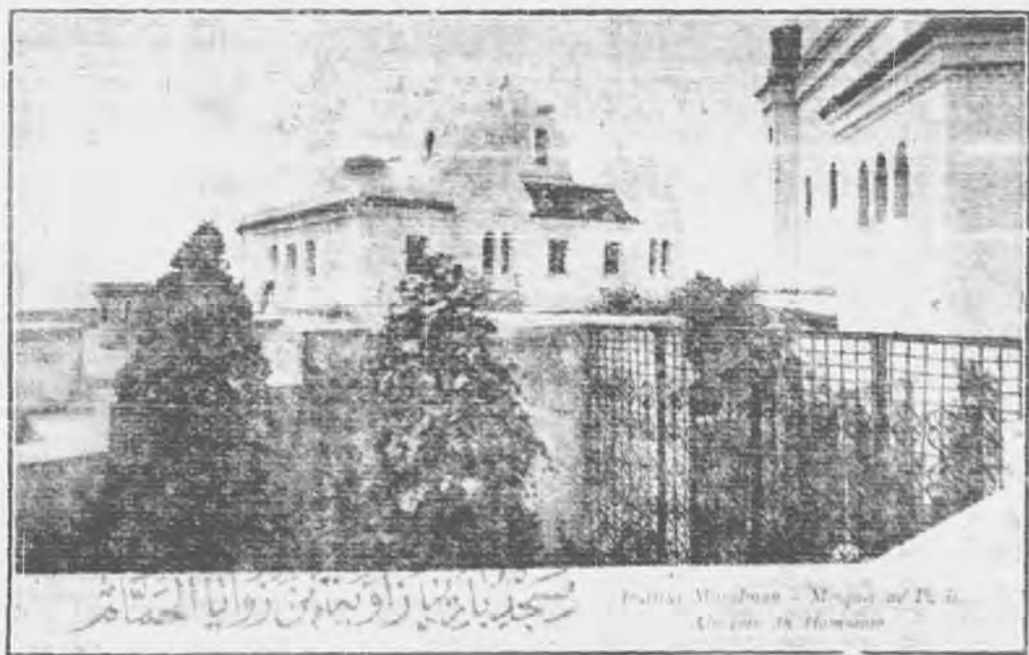
巴 黎 清 真 寺 一

石頭是假，請將你的頭和石頭撞撞看！試問痛不痛？橙子吃到嘴又香又甜，吃得不亦樂乎的時候，那