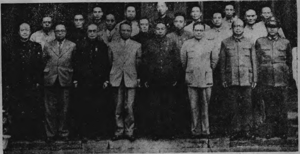
右至左： 保安副司令 馬守授 省府秘書長 葛單 省教育廳長 陳去惑 省農林廳長 譚克敏 省建設廳長 向震 省財政廳長 謝傑民 省民政廳長 袁政斌 省新聞處長 吳開勛 省人事處長 鄧崇津 省府秘書長 楊森 省田賦處長 李御良 省衛生處長 賈智欽 省建設廳長 何輯五 省廳長 齊衛蓮 省府秘書長 楊文泉 省府秘書長 李實 省府秘書長 譚啓棟 省府秘書長 梅光復 省府秘書長 傅啓學 省府秘書長 陳光煇 省府秘書長 周達時