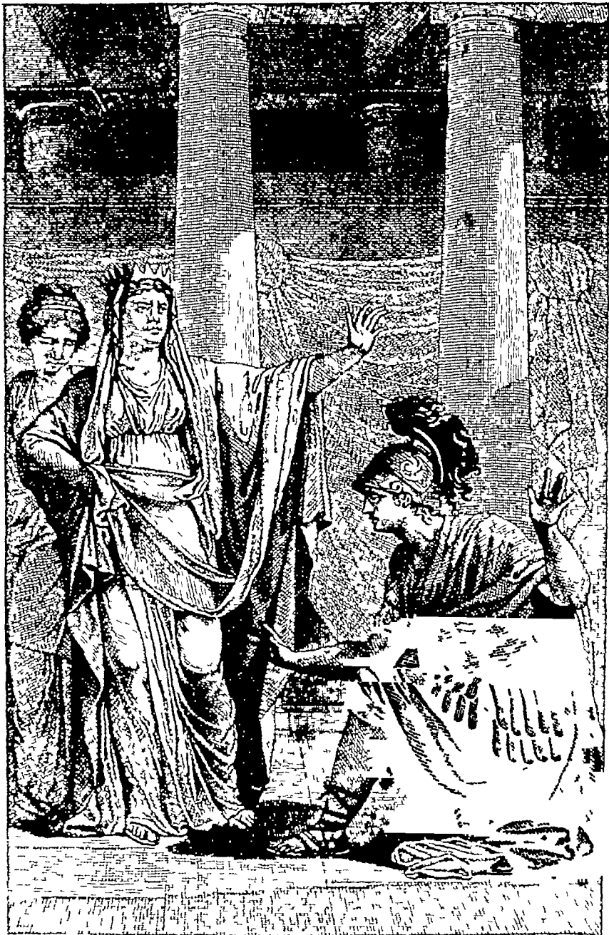
Fig. n. 14