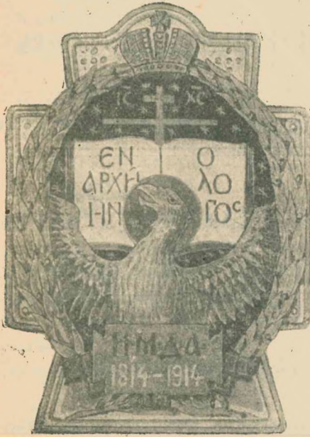
Видъ нагруднаго знака.

ноября 1915 года, въ Царскомъ Селѣ, Всемилостивѣйше соизволил на учрежденіе нагруднаго знака въ память 100-лѣтія Императорской Московской духовной академіи по представленному рисунку и на основаніяхъ особаго Положенія о немъ.