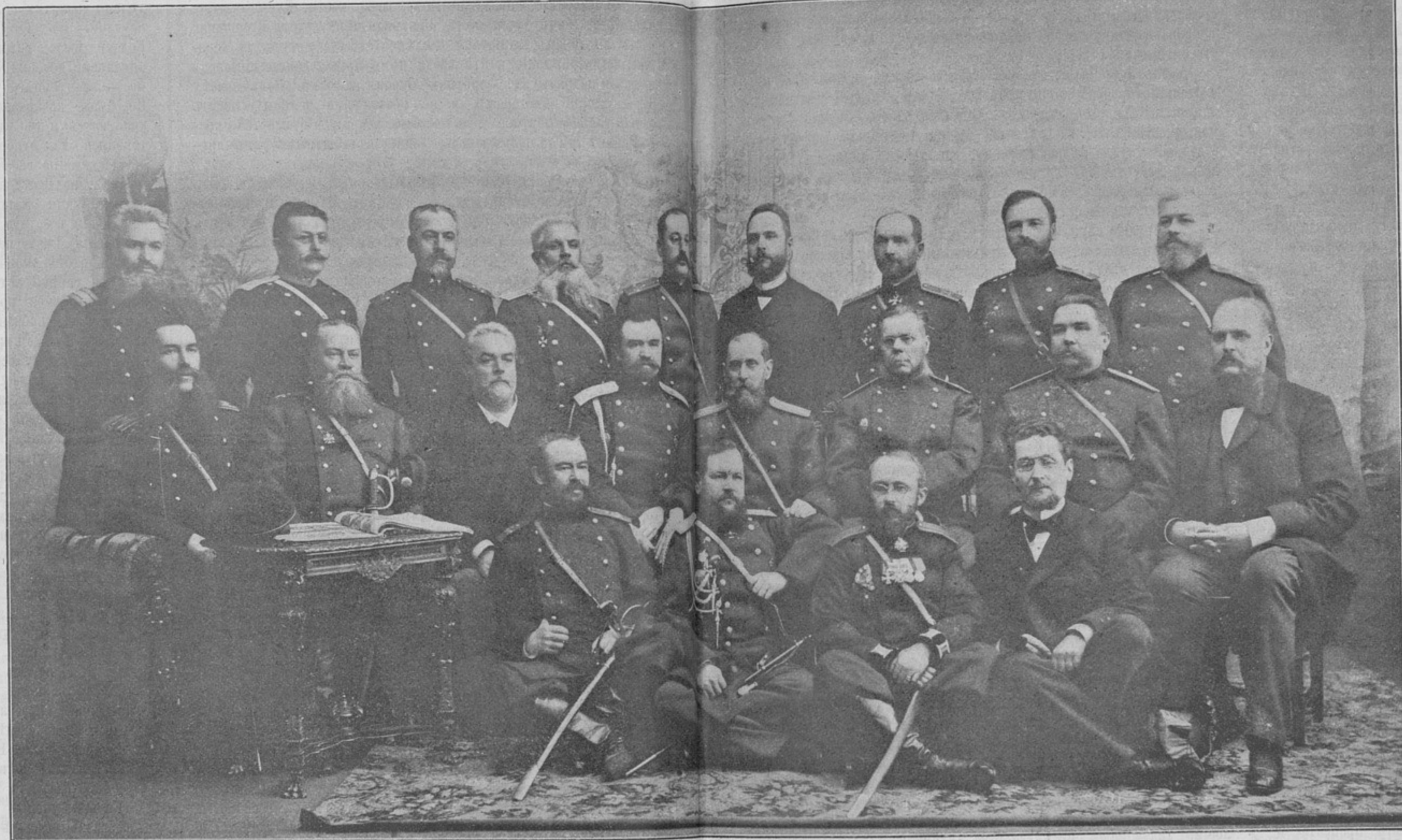
Группа бывшихъ воспитанниковъ 2-го Московскаго Императора Николая I-го кадетскаго корпуса.

Настоящаго бѣлаго очерка развитія крѣпостной артиллеріи вполне достаточно, чтобы убѣдиться, какую массу силъ и труда должны были положить крѣпостные артиллеристы и ихъ руководители, чтобы достигнуть того прекраснаго состоянія, въ которомъ они предста-