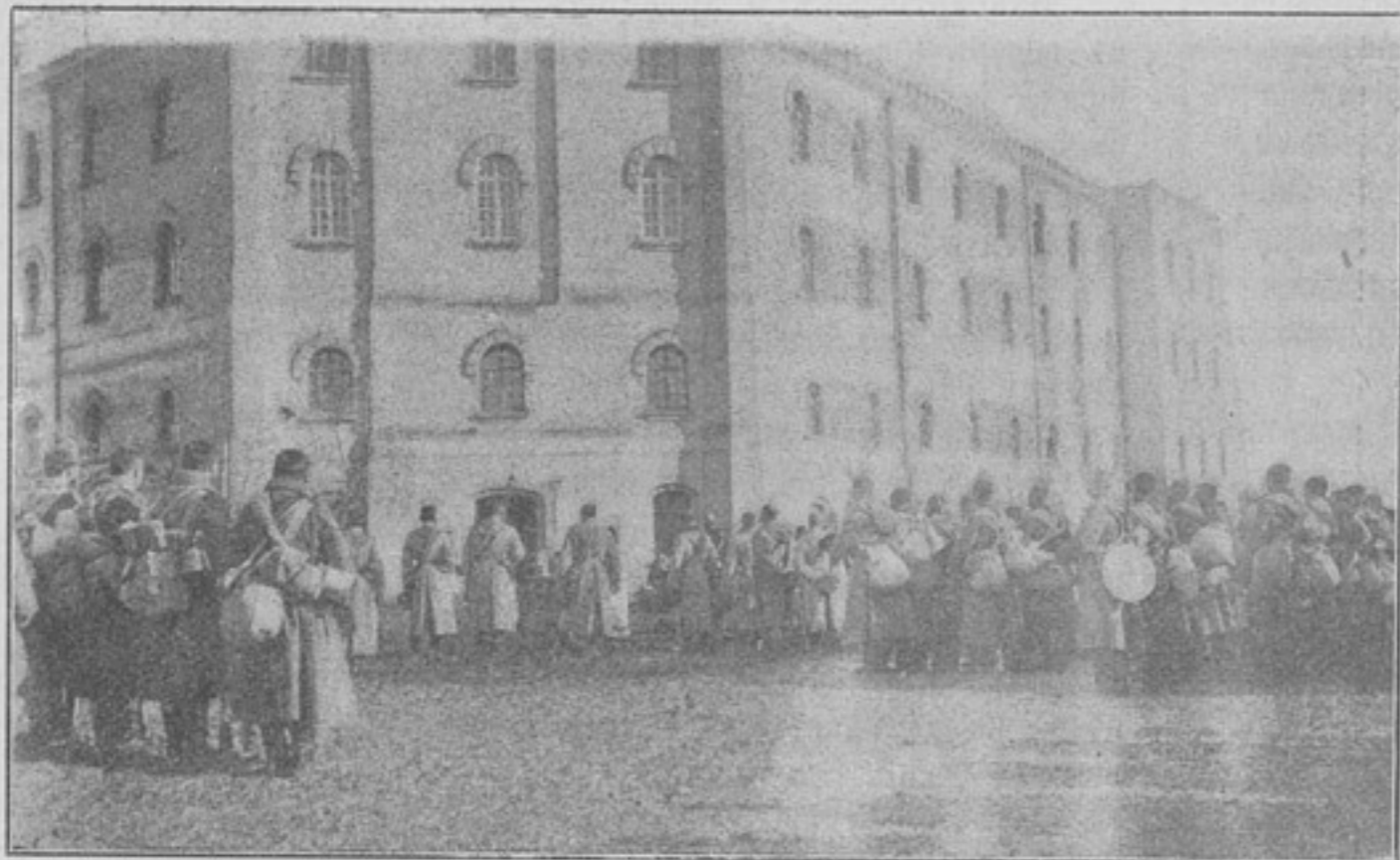
Прощальный молебень (къ статьѣ «Кавказскіе стрѣлки за Каспіемъ»).

Къ сожалѣнію, какъ о походномъ движеніи баталіоновъ, такъ и о пребываніи ихъ въ области не осталось никакихъ печатныхъ памятниковъ. Для исторіи бригады прошли безслѣдно и походныя испытанія и бытовая жизнь баталіоновъ за указанный періодъ. Единственнымъ наслѣдіемъ похода остался «усиленно-мирный» составъ, въ каковомъ баталіоны остались и по возвращеніи изъ области.