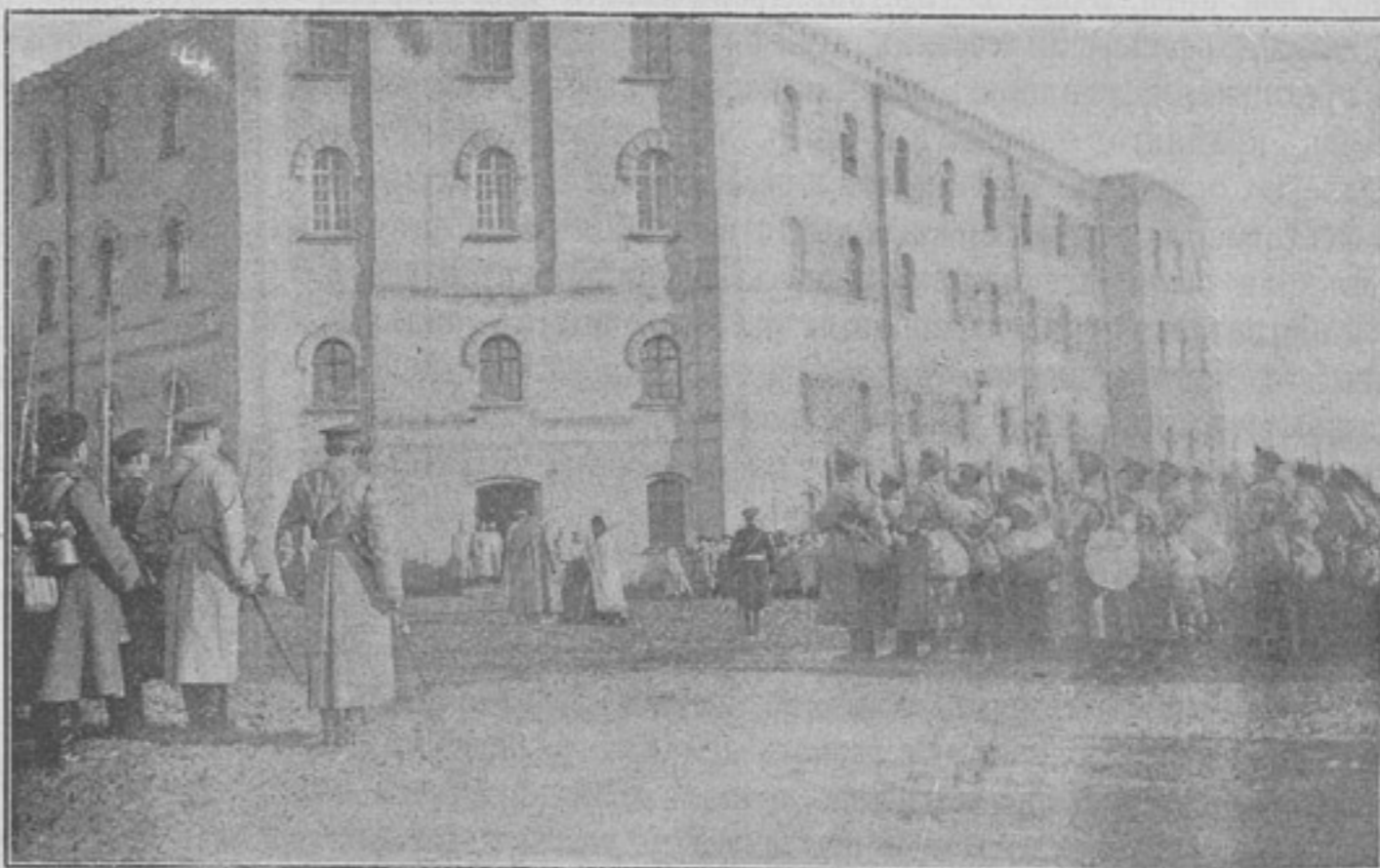
Выносъ знамени (къ статьѣ «Кавказскіе стрѣлки за Каспіемъ»).

Офицерство энергически заканчиваетъ свои сборы. Кто пломбируетъ зубы, кто подводитъ сердечные итоги, кто покупаетъ бурочные сапоги да теплое платье... Общее настроеніе