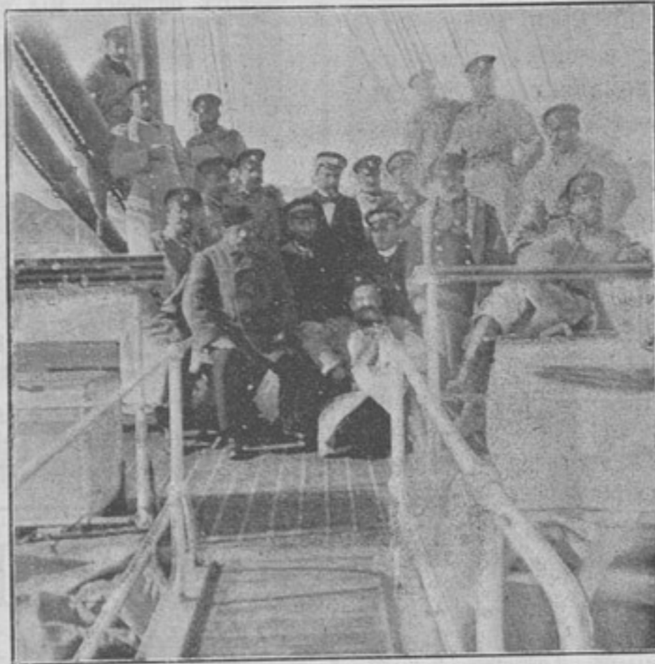
Группа офицеровъ на «Великомъ князѣ Алексѣй» (къ статьѣ «Кавказскіе стрѣлки за Каспіемъ»).

Со ст. «Карабуджахъ» начинается темнѣть. Утаптываемся, располагаемся спать, по два человѣка въ купѣ. Я помѣстился съ капитаномъ кн. Л—зе. Цѣлый день у насъ гостили въ купѣ его два борзыхъ щенка «Ледисмитъ» и «Бурка», на