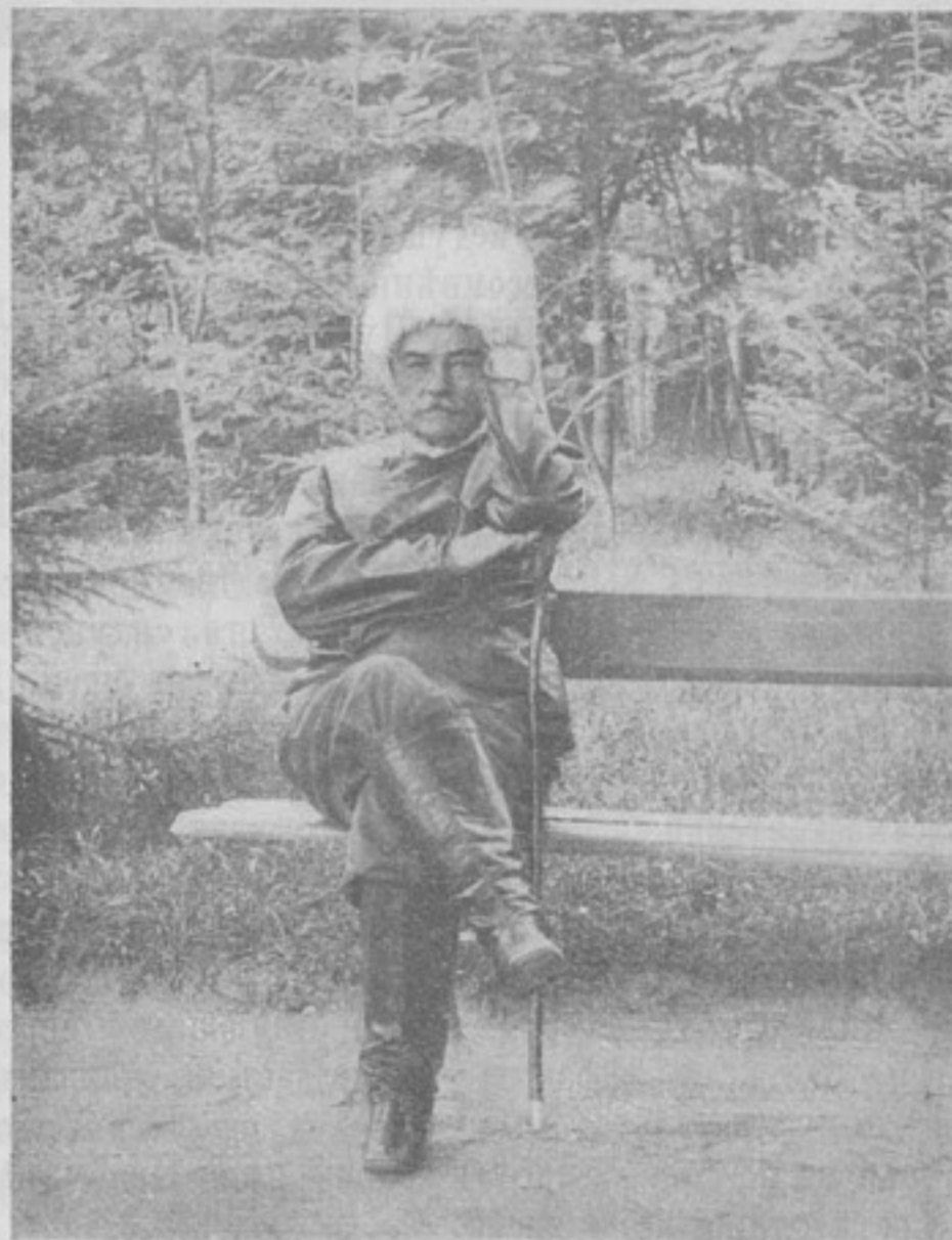
М. И. Драгомировъ въ 1904 году.

Войсковыя части представляютъ собою живые организмы, отличающіеся особенной инертностью. Разъ установившаяся рутина взаимоотношеній и внутренняго порядка прочно удерживается цѣлыми поколѣніями и сдвигъ въ сторону требуетъ титаническихъ усилій. А М. И. Драгомировъ именно