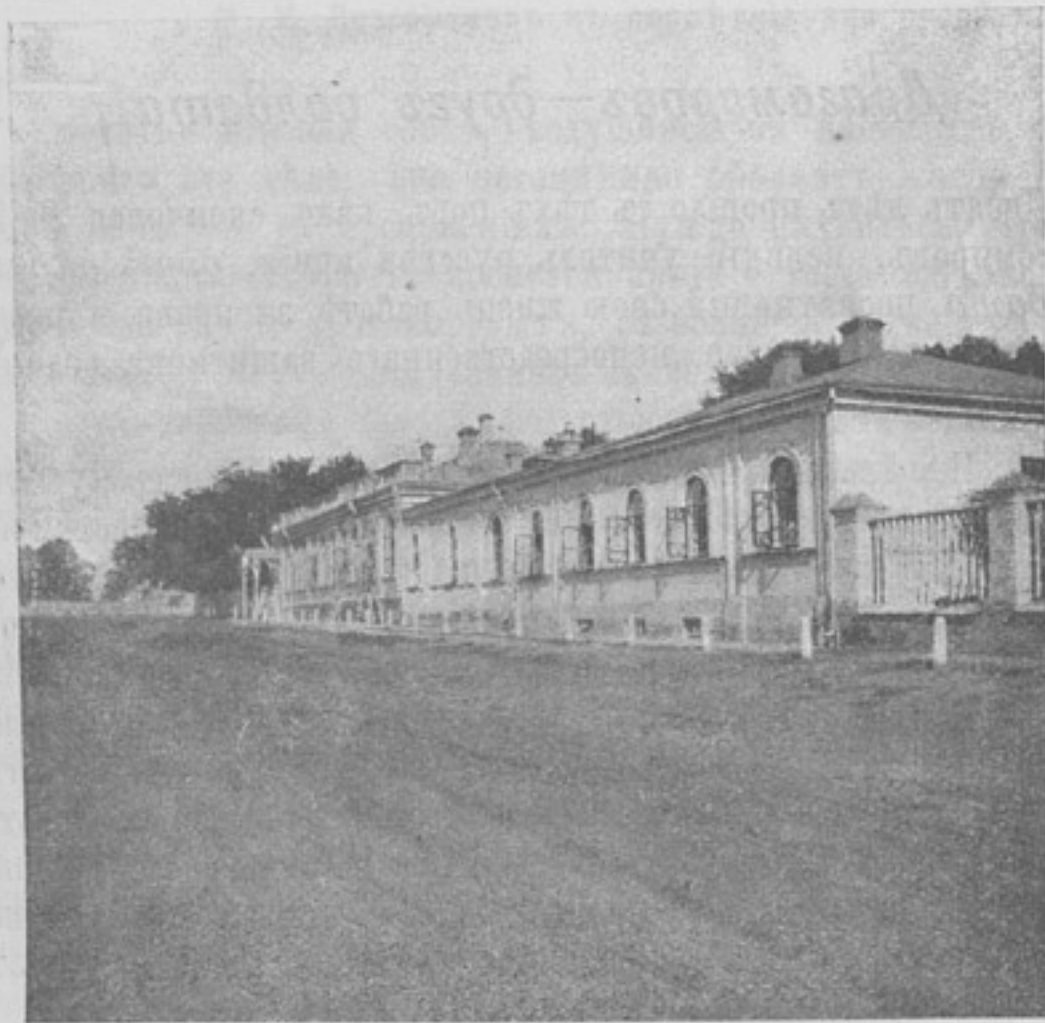
Домъ М. И. Драгомирова въ Конотопѣ, гдѣ скончался Михаилъ Ивановичъ.

Требую безпрекословнаго повиновенія, онъ не допускалъ разсужденія въ вопросѣ, нужно ли исполнить приказаніе.