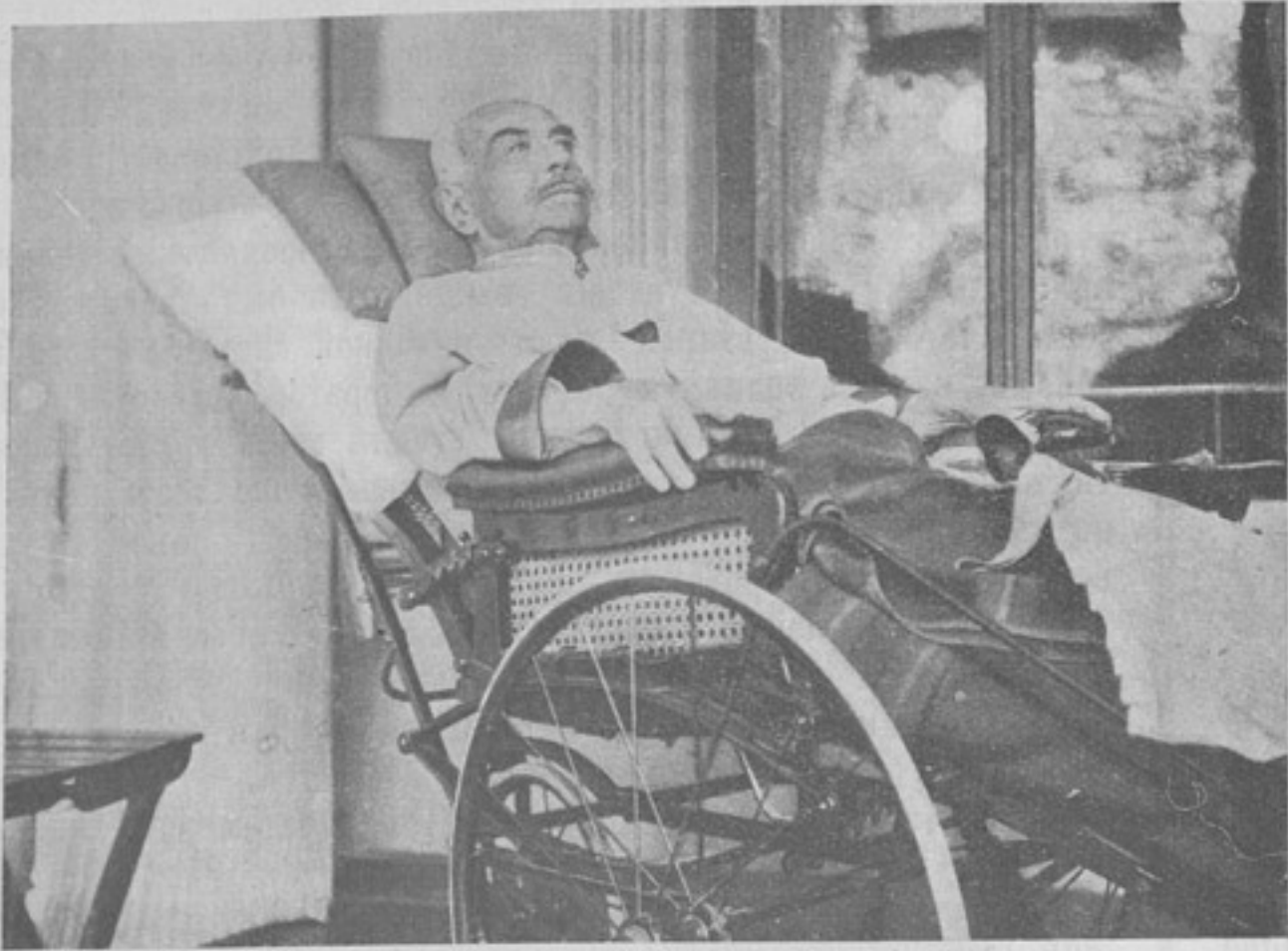
М. И. Драгомировъ въ послѣдніе дни своей жизни.

Великая мировая война, ведущаяся въ настоящее время облегчить это дѣло, она несомнѣнно обновитъ жизнь народовъ во всѣхъ ея проявленіяхъ. Нужно надѣяться, что это обновленіе прежде всего коснется арміи и тогда идеалы, выдвинутые М. И. Драгомировымъ, съ большей легкостью проникнутъ во внутренній обиходъ жизни войсковыхъ частей.