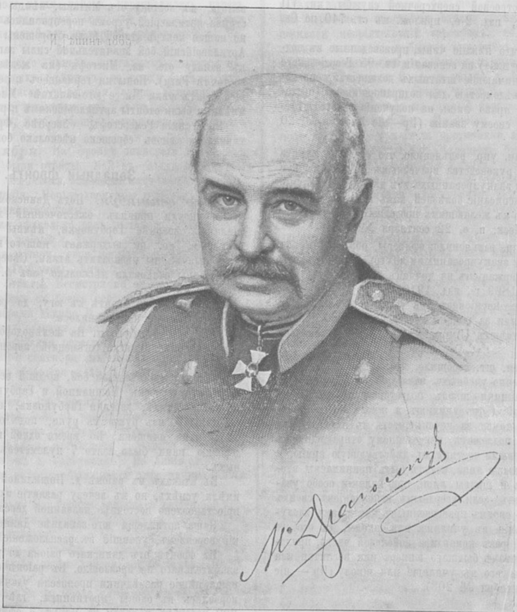
Генераль-адъютантъ Михаилъ Ивановичъ ДРАГОМИРОВЪ.

СОДЕРЖАНИЕ: Портретъ генераль-адъютанта Михаила Ивановича Драгомирова. — Распоряженія по военному въ- домству. — Война. — М. И. Драгомировъ — въ роли воспитателя русской арміи. К. Адариди. — Роль М. И. Драгомирова въ такти- ческой подготовкѣ войскъ. Э. Сеидзинскій. — Полувѣковая борьба изъ-за привциповт. — iii. — Драгомировъ — другъ солдата. Старый ротный командиръ. — Уральская папаха М. И. Драгомирова. В. Березовскій. — Открытое письмо королю болгарскому Фердинанду. С. М. Лукомская. — Корреспонденція. — Свѣдѣнія объ убитыхъ и раненыхъ. — Вопросы и отвѣты. — Почтовый ящикъ. — Объявленія.