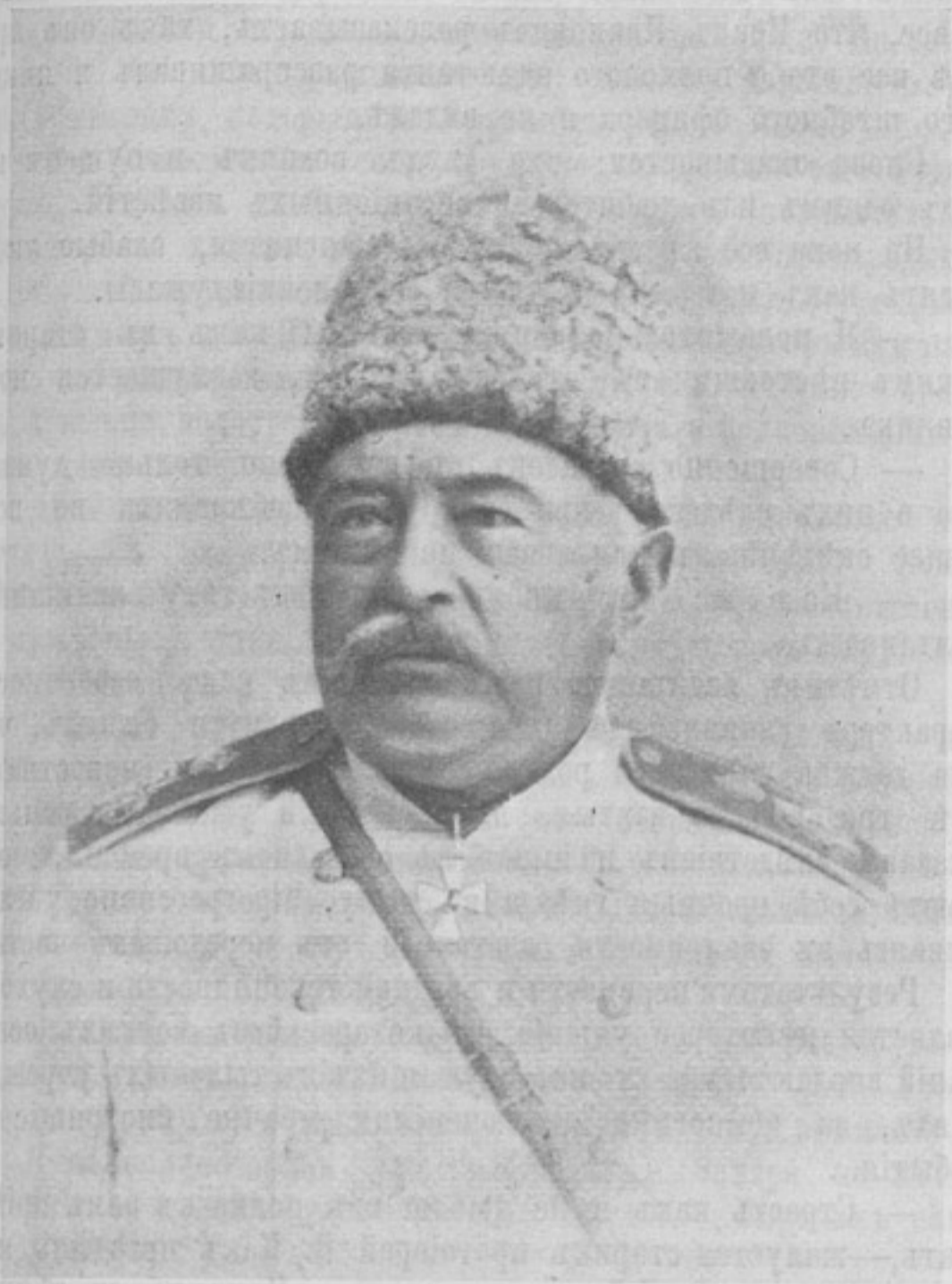
Михаилъ Ивановичъ Драгомировъ въ уральской папахѣ.