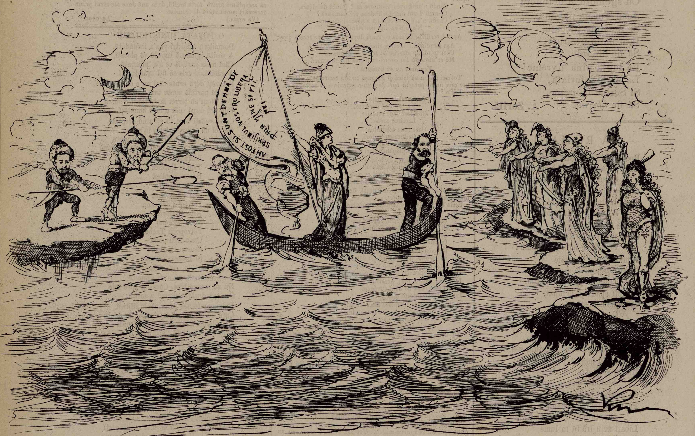
Cu astū-felū de vîslași, sper a ajunge la bunū limanū.