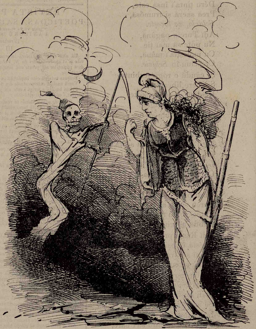
Du-te în smēcurile stambululū, căci aici la mine toți te desprețnesc, și n'ăi ce căta!