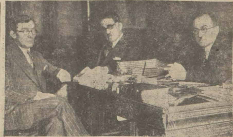
Dün vilâyette tahlif edilen ve ilk içtimasını yapan İhtikârî tetkik komisyonu