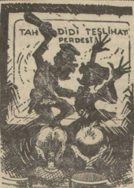
(Bir Avrupa karikatürü) Tahdidi teslihat sahnesinde seyircilerin zevkini bozan bir kavgâ

Kralın rakip olduğu vapur, saat 18 de İstanbul'a hareket etmiştir.