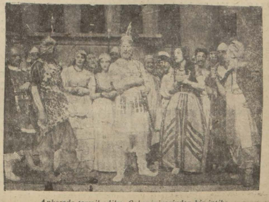
Ankarada temsil edilen Çoban piyesinden bir intiba

nun gibi yalnız çocuk portreleri yapanlar, yalnız natürmort yapanlar, hattâ yalnız çiçek resimleri yapanlar da vardır. Bugün hislerini daha geniş bir surette ifade etmek için böyle san'ati bir ihtisas köşesinden görmek istemeyen ve fırçasını her mevzuada işletebilmek kudret ve cesaretini gösterenler de vardır. Saip Bey yalnız portre ile meşgul olmuş denebilir. Bu defa teşhir ettiği kırkı müteceviz portreler arasında pek güzelleri, muvaffak olmuşları vardır. Resimlerimiz Saip Beyin sergisinden almış iki portrenin fotoğrafıdır. Renkler ve hatlar canlıdır. Saip Beyi samimiyetle tebrik ederiz.