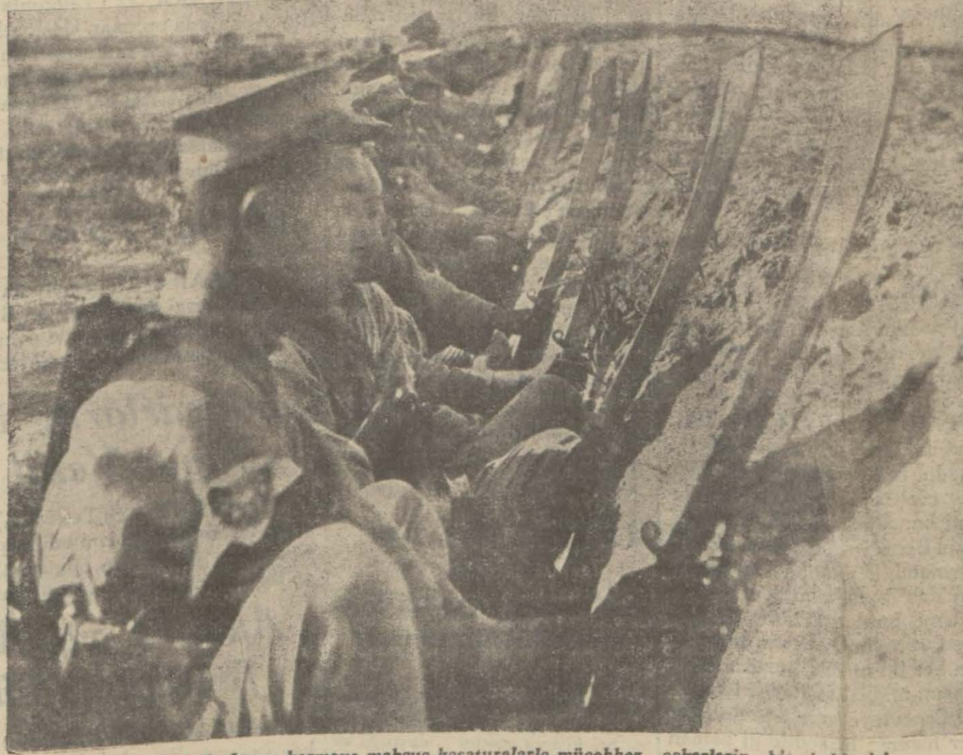
Çin siperlerinde Japon kesmeye mahsus kasaturalarla müehhez askerlerin bir bekleyişi

Herhalde milli ajansın hususî istihbarat şebekesi teşkil etmesi zaruridir. Anadolu Ajansı bütün dünya ile rabıtamızı temin eden bir nevi anten vaziyetindedir. Gazetelerimizin mali vaziyetleri hakkında memleketlerin gazeteleri ile kıyas kabul etmeyecek derecede zayıf olduğundan, hiç birinin Avrupa merkezlerinde hususî muhabir buldurmasına imkân yoktur. Bu itibarla matbuatımız her memleketin matbuatından ziyade ajans servislerine mühtaçtır. Bu servisler de hâdisatı kendi rüyeyet zaviyelerinden görür ve biz de o şekilde aksettirilirse, dünyayı başkalarının gözleriyle görmüş oluruz.