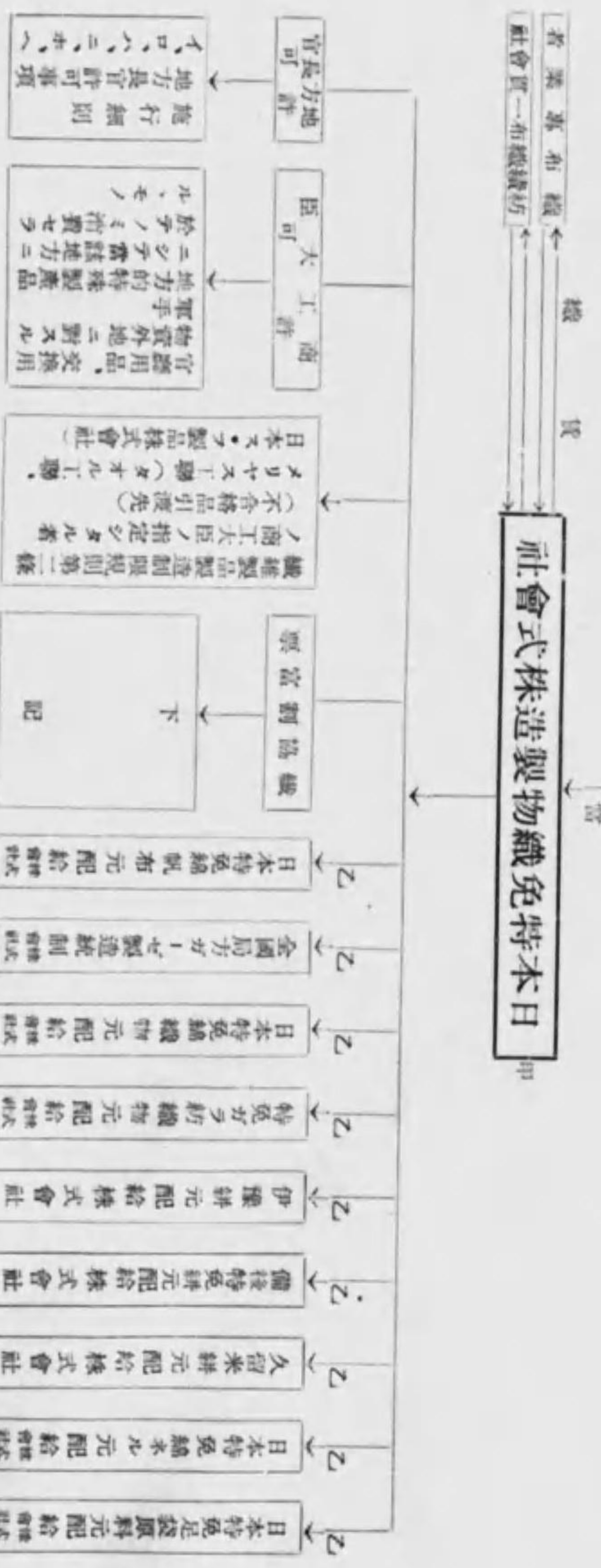
特免綿織物配給系統圖