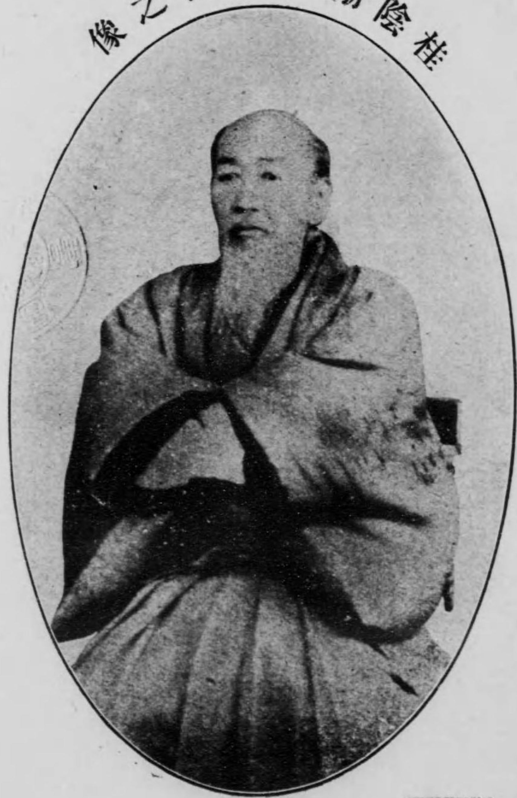
桂陰棚谷元善之像