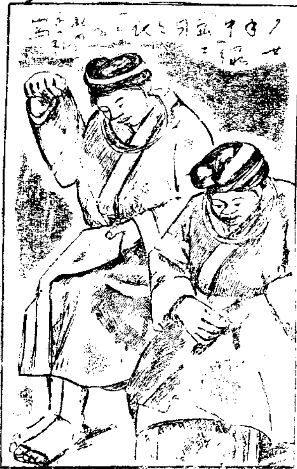
抗戰時期，凡我國民，無不努力，力抗戰工之作之義務。前方無後方，前方無後方。示苗胞為前方將士製寒衣情形。