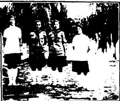
繩毽子比賽優勝者 毽子繩