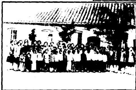
民衆學校全體師生