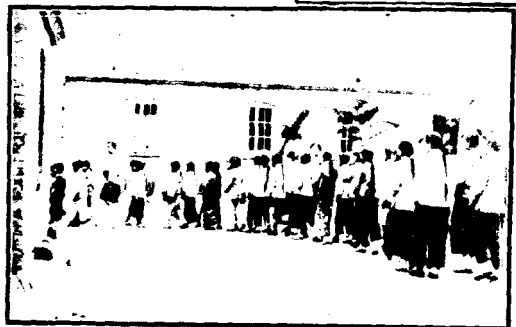
民衆學校散學情形