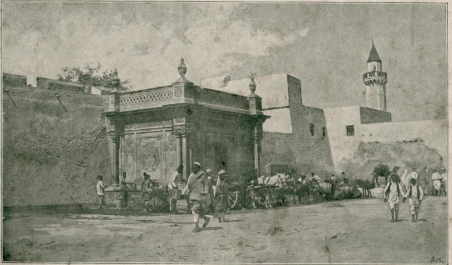
[ طرابلس غربده بر چشمه ]