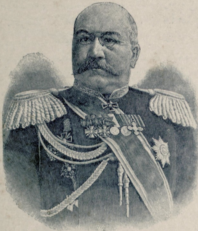
[ روسیه حربیه ناظر جدیدی جنرال قورویانکین ]

مواستمزدن بکرمی دقیقه اول کفره ده بولان مشایخ، درویشان وطبه علوم ایله واحه تک همان عموم سکنه سی - اوکاریده نسید سنوی حضرتلرینک اک ایلری کلن سردارنن سید محمد البسکری اولدی حالد - اسقمازله کلهرک ذات شوکتیهات حضرت خلافتی به دعادن سکره راسمه خوش آمدی بی اضا وسید مشارالیهک سلامی تبلیغ ایتدیله اورادن هپ برلکه زاویه بولی طوندق وساعت درنده زاویه مواصلت ایلدک. هان مهماندارمن محمد البسکری معینده سید سنویک طلبه سنن و کوله لریدن بر قاجی اولدی حالد قافله من خلقتی اولجه حاضر لامش اولان محله، یرلشد - بردی. بسکا وراقمه کی خاطر لجه بعض ذوات ایله افراد شاهانه سید سنویک ساکن اولدی خاتمه سلاطی بلوکی شخص امتشردی. هیمز برلر مزه چکلده.