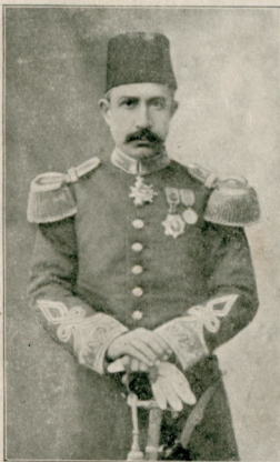
ارکان حربیه میرلورلردن مرحوم امین پاشا Emin Pacha Mort à Constantinople.

چونکه قادیسز ، یض امیلسز ، هیجانسز ، المیز سویورم ؛ چونکه بتون قادیسزلی بردن چیلغینجه سویور ، باشقه - لرینیک بر قاجندن چکدکاری الماری سانکه آری آری هینسندن چکیورم ؛ بر نظر لریله سانکه بتون بر حیات یاشیورم . و بونظردن اویانجه کندیمی بنه بالکز ، بالکز ، ایدیا بالکز لعه محکوم کوریورم... —