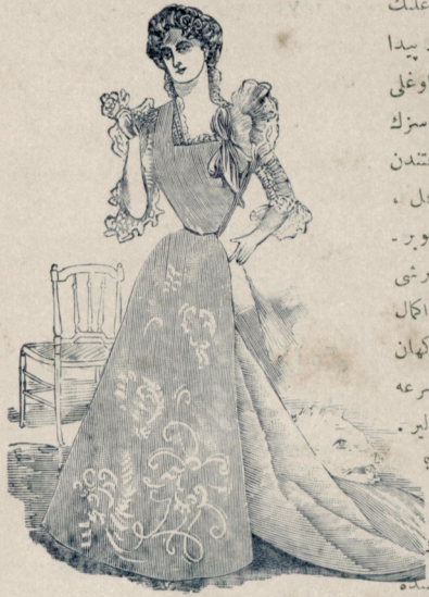
[ موده ]

بدبختیسنک آتده چوکن اوغلتک حالی والدهسنده یومشامه برانمعداد پیدا ایتمکدهدر . حتی رتهور اشاسنده اوغلی کندیسنه : « ایدی کیتدی . فقط سزک سبکیزله کیتدی ، والده . اوک قباحتدن مستول سزسکنز • اصل اولندن دکل ، سزیدن نفرت ایدیورم .» دیدیکی زمان بور- عظمت قادین ساکت وحران قایلر ، برشی بایه ماز . بوندن اناغیسنی کوچک کلیساامال ایدر : قادیغیز برکون اورادن کچرکن ناکهان اکشاف ابدن برحسله دیز چوکهک تضرعه باشلار . برطغان بکایه برقرار نجیب آلیر . قباحتک مسؤلیتی اولک ایش ، اوله می ؟ او حالده بونی تعمیر ایده چک .