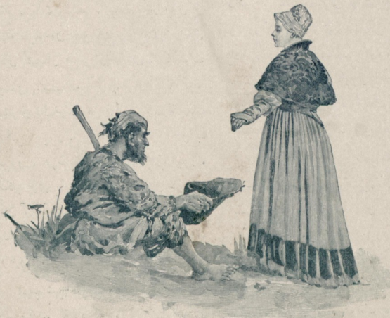
[ موريس لهوارك لوحه لرندن : صدقه ]

صلى ، ۲۴ نسر به اول — صباحلين ياريمده بوله چيقان قافله مز ساعت آتى يچمده كفره ماحققانمن هوارى نمانده كى واحه صغريه موصلت ايتدى . بوراده خرما اناجار يله سو و امض سكه بولنديغندن آرقه داشلام ، خصوصيله دوه خيلر بوكون بوراده آرام و يتوت ايمكى آرزو ايتديلر . واقعا كفره به سكر طقوز ساعت قدر يولز قالمش ايسده بوكونى هواريده كيبه جك اولور سهق يارين كفره به داخل اوله ميه جغمز محقق ايدى ؛ زيرا اعتيادات محلله دن اوله رقى قافله لر بيوك بر ره ، باخصوص كفره كى شيخ سنوسى حضرتالرينك مقر جددى اولان بر محله ممكن اولدينى قدر وقتسده كيرمك ، برده ك كوزل ، لك تيز البه ليرى لابس بولمق اقضا ايتديكندن شايد بوكون هواريده قاليه سهق يارين كفره به داخل اوله . بوب خارجنده توقفله ايجق او بركون كره سيه جكمزى و بوسورتله تمام بركون غائب ايدم جكمزى درميان ايتدم . بونك