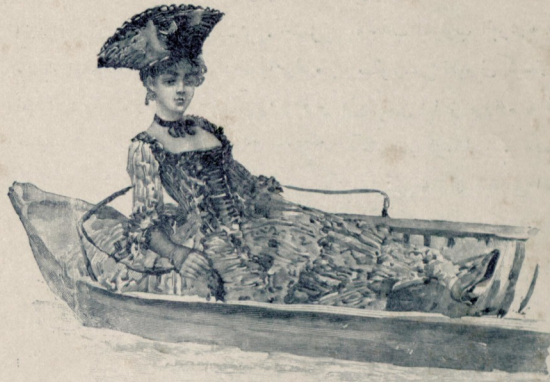
[ رسام موريس لهوارك لوحه لرندن : صدالده ]

هيجان و حرڪت ، او قدر آثار شوق و شطارت حكم فرما ايدي كه موقع آرائم عادتاً بر دوكون يرينه بگزيبوردى . مهماندارلم محمل مواسلتى و ايرتسى كون كفره به داخل اوله جغمزى اخبار ايمك اوزره رفقا مزدن شيخ السيد محمد الفاتورى ي زاويه بكوندر دبلر . بوكون اون بر ساعت و برجاريك يول يورومشز .