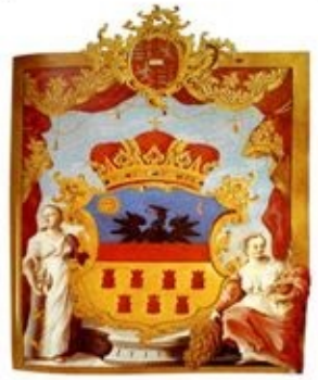
ERDELYI NAGYFELSÉLEMSÉG 1778

Regio. Imperatoris Transilvaniae Subemiae Rebus die 10 Junii 1789