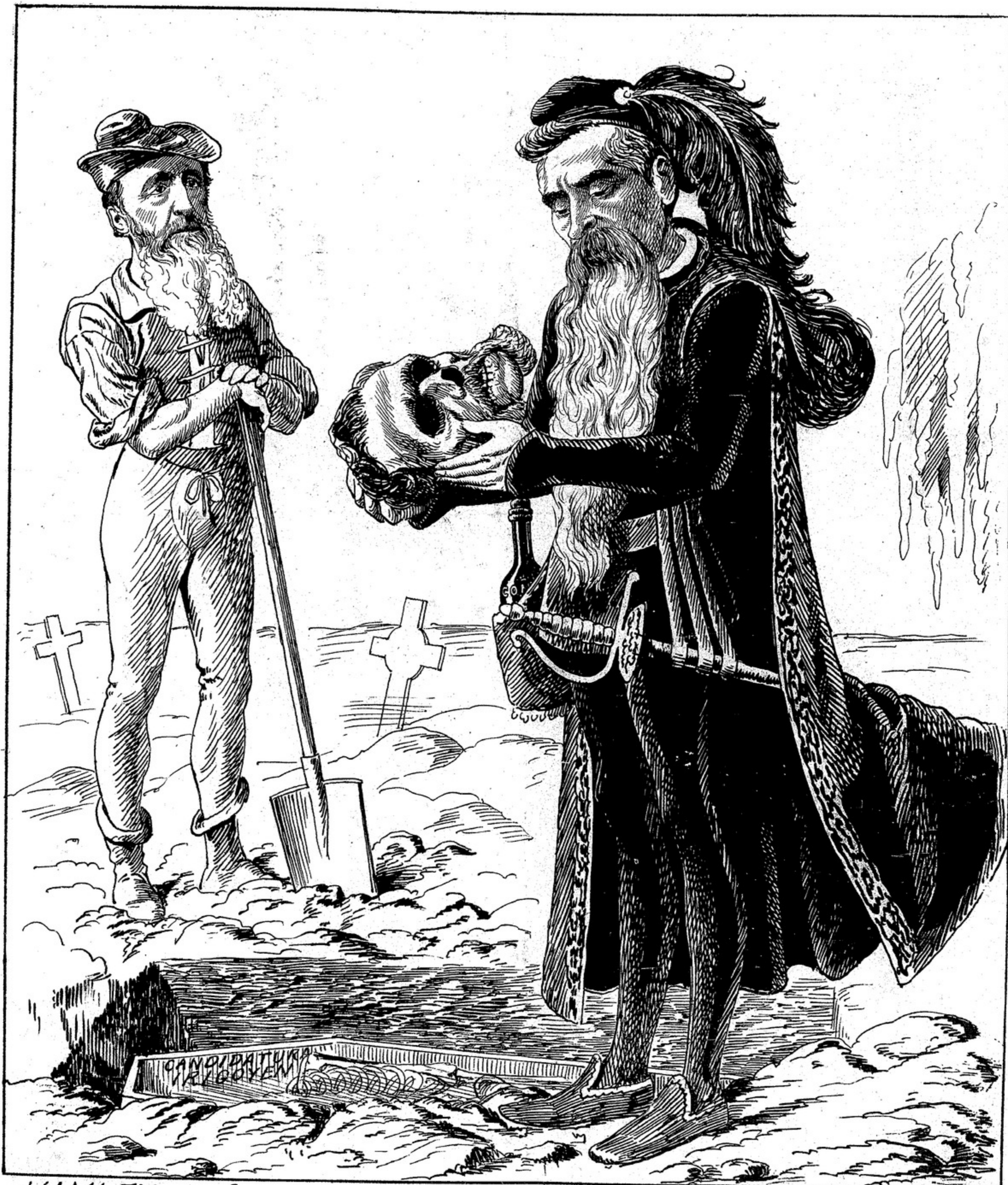
HAMLET:— Ser o no ser.....! Esta es la cuestion!

ADMINISTRACION - PAPELERIA ARTISTICA, Tucuman esquina San Martin - BUENOS AIRES